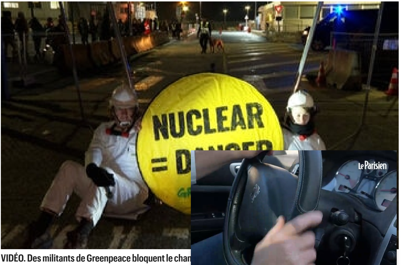
VIDÉO. Des militants de Greenpeace bloquent le char candidats pro-nucléaires