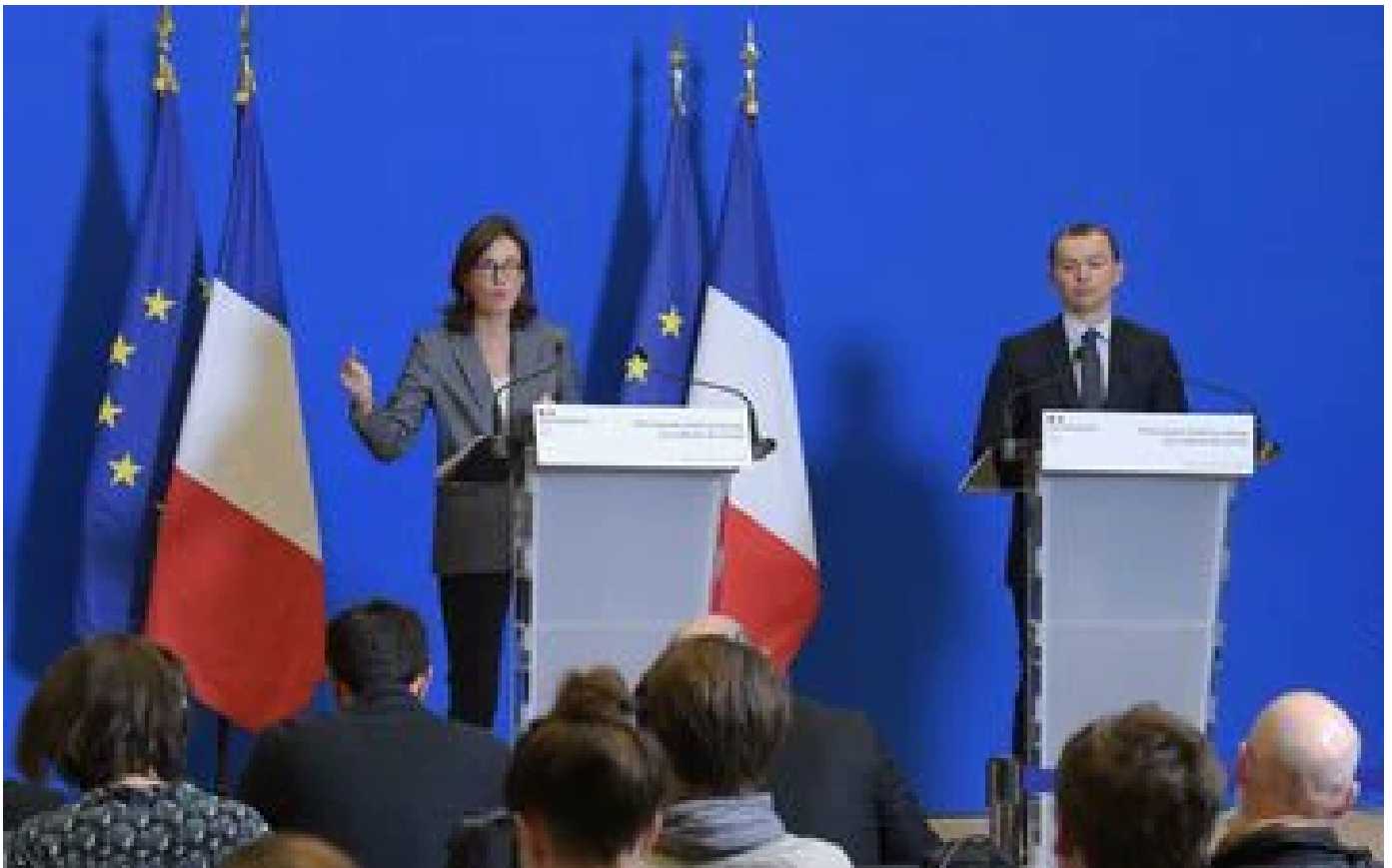
McKinsey : le gouvernement se défend d'un recours disproportionné aux cabinets de conseil