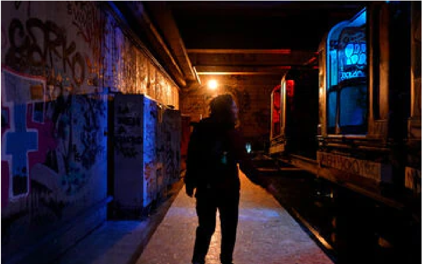
VIDÉO. «C'est apocalyptique»: dans les entrailles du mini-métro abandonné de Seine-Saint-Denis