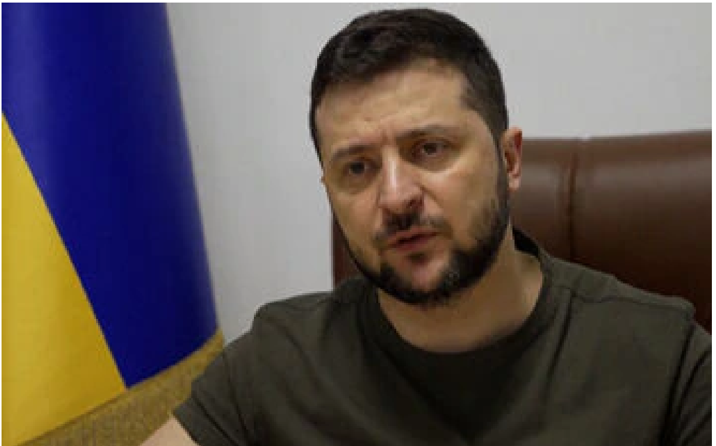
VIDÉO. Guerre en Ukraine : Zelensky appelle à arrêter «toute activité commerciale avec la Russie»