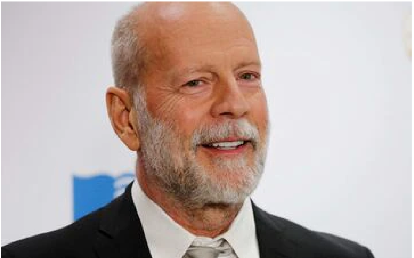
VIDÉO. Fin de carrière pour Bruce Willis: on revient sur ses 5 films les plus cultes