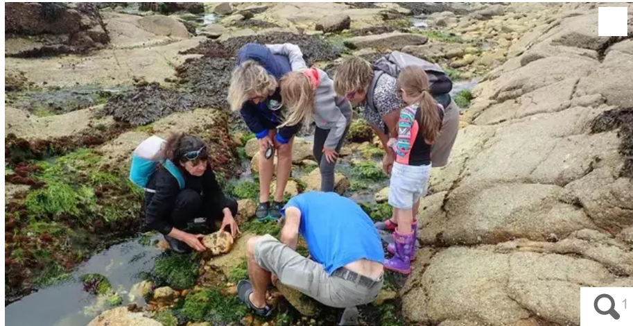
L'association Graine d'Océan proposera une sortie découverte de l'estran dimanche 3 avril 2022 de 12 h à 14 h.

Dimanche 3 avril 2022, le cœur du Fort Bloqué aura une allure de fête avec le village Sport et santé de La Littorale 56. Place des Goémoniers, enfants et adultes pourront profiter d'animations gratuites en continu de 10 h à 17 h.