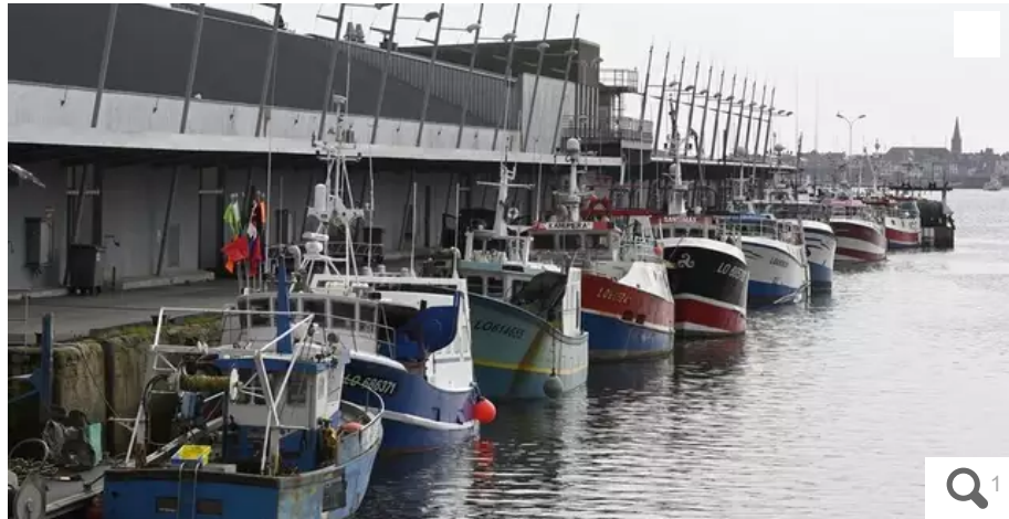
À Lorient, les bateaux de pêche, à quai depuis lundi, reprendront la mer ce jeudi.

Dans un communiqué, le comité régional des pêches maritimes de Bretagne salue l'annonce par le Premier ministre, Jean Castex, de l'aide financière exceptionnelle de 35 centimes par litre de gazole accordée aux entreprises de pêche. À Lorient, les bateaux de pêche, à quai depuis lundi, reprendront la mer ce jeudi.