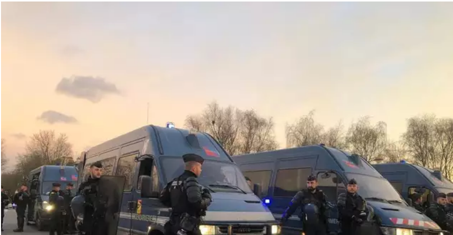
Ce mercredi 16 mars, vers 18 h 45, les entreprises de travaux publics et agricoles qui bloquaient les accès du dépôt pétrolier et de la criée du port de pêche de Keroman à Lorient (Morbihan), ont été évacués. D'importants moyens de police et de gendarmerie ont été déployés.