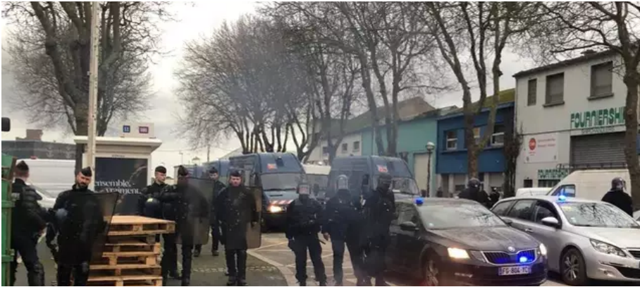
Ce mercredi 16 mars, vers 18 h 45, les entreprises de travaux publics et agricoles qui bloquaient les accès du dépôt pétrolier et de la criée du port de pêche de Keroman à Lorient (Morbihan), ont été évacués. D'importants moyens de police et de gendarmerie ont été déployés.