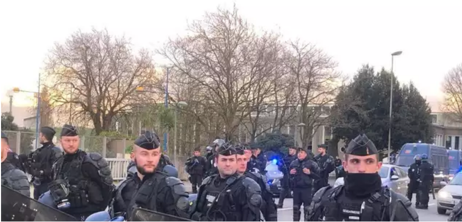
Ce mercredi 16 mars, vers 18 h 45, les entreprises de travaux publics et agricoles qui bloquaient les accès du dépôt pétrolier et de la criée du port de pêche de Keroman à Lorient (Morbihan), ont été évacués. D'importants moyens de police et de gendarmerie ont été déployés.