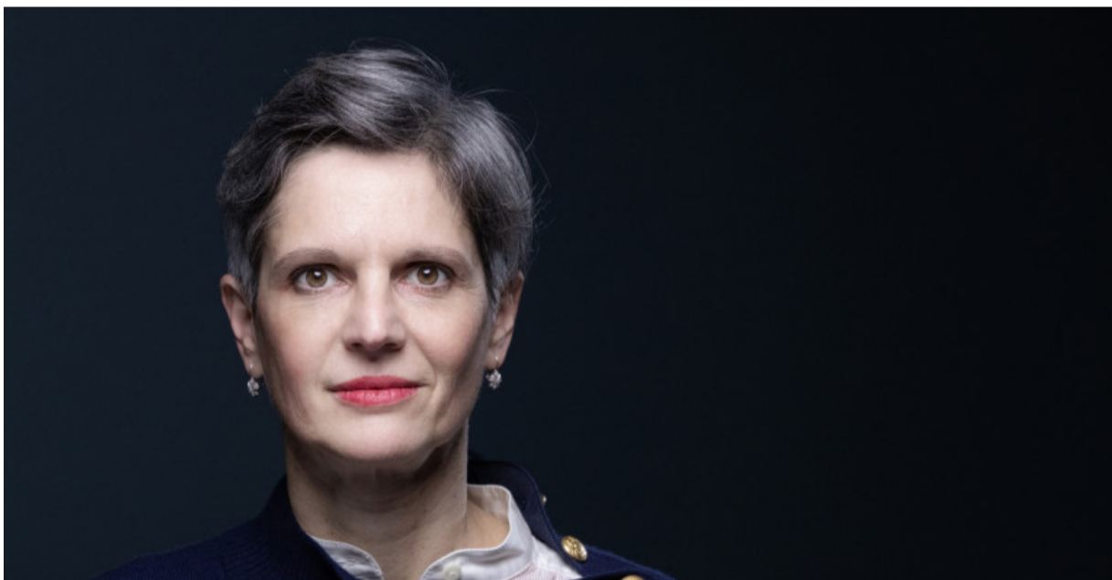
Sandrine Rousseau, le 10 décembre 2020.

Lors d'un débat, Sandrine Rousseau a affirmé qu'elle ne voulait plus "faire de la politique dans des groupes du Ku Klux Klan". Elle a ensuite reconnu une expression "volontairement choquante" et "maladroite".