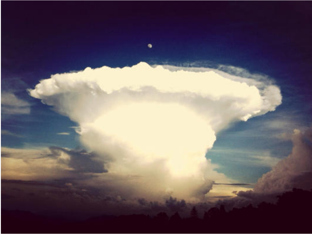
Une explosion de bombe nucléaire