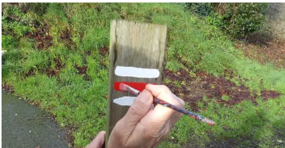
Les bénévoles de la FFR du Morbihan balisent les sentiers.

La création d'un sentier, c'est 70 % d'administratif.