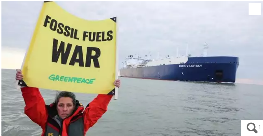
Greenpeace a manifesté sur la Loire et à terre devant le terminal méthanier.

Êtes-vous POUR ou CONTRE la levée de brevets sur les vaccins anti-Covid ?