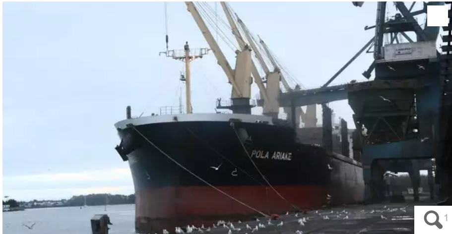
Mercredi soir 2 mars 2022, le Pola Ariake était toujours consigné à quai à Lorient.

Le Pola Ariake bat pavillon panaméen mais il est la propriété la Compagnie ministérielle russe des transports, indique la direction du port de Lorient (Morbihan). C'est pour cette raison que le Pola Ariake a été consigné à quai. Il s'agit là d'une conséquence des sanctions européennes à l'égard des intérêts financiers russes, liée à l'invasion de l'Ukraine.