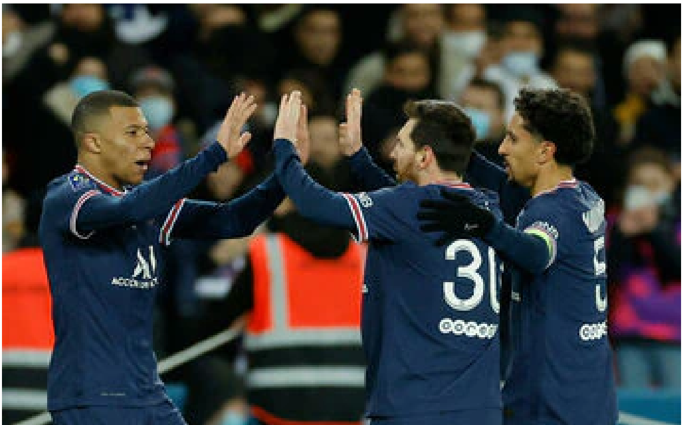
PSG - Saint-Etienne (3-1) : «Etre le meilleur buteur de l'histoire du PSG, on ne peut pas cracher dessus», confie Kylian Mbappé