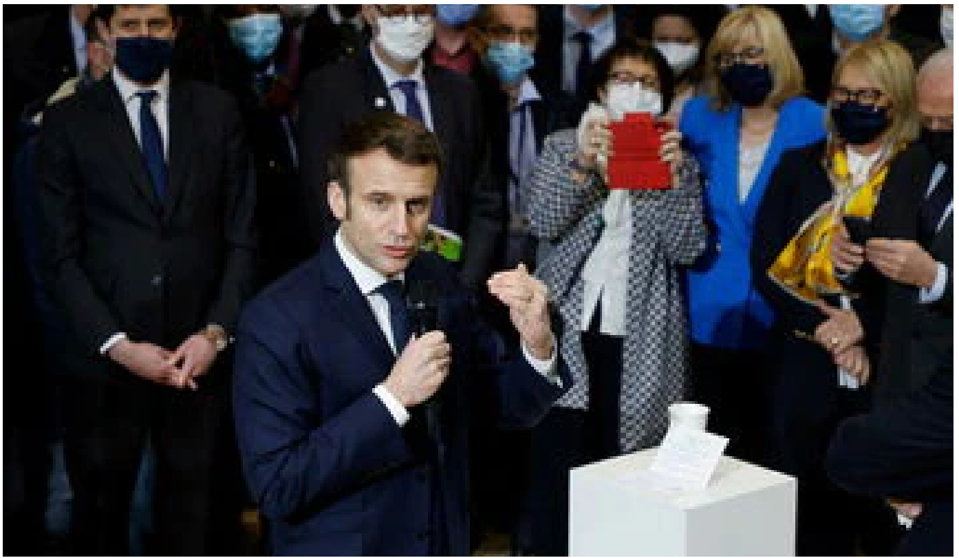
Salon de l'agriculture : la guerre en Ukraine «durera», prévient Macron qui convoque un Conseil de défense