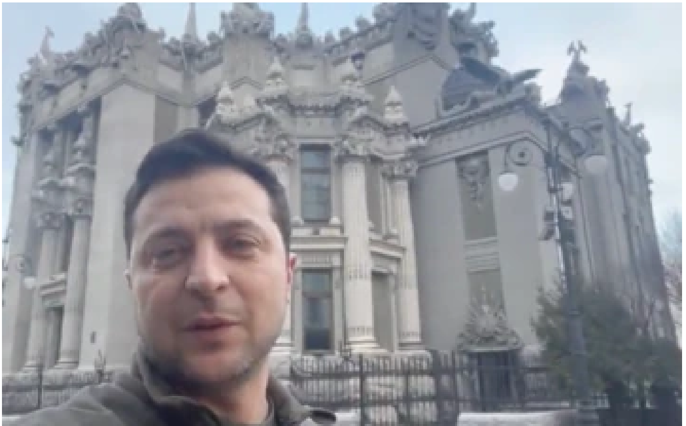
VIDÉO. «Je suis là et on va défendre l'Ukraine» : Volodymyr Zelensky envoie un nouveau message à ses compatriotes