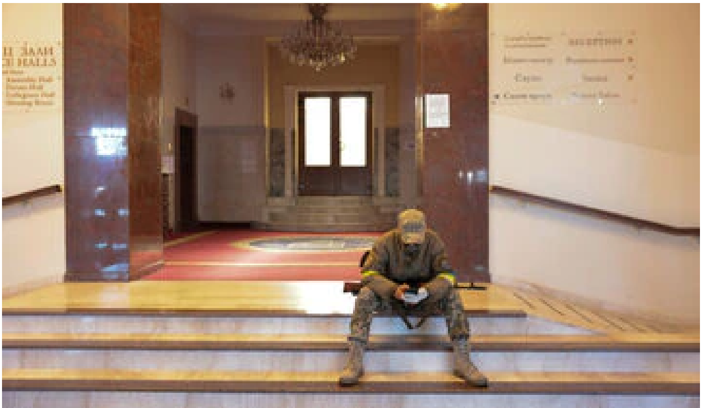
Guerre en Ukraine : Zelensky prêt à négocier, mais pas en Biélorussie comme l'entendait Poutine