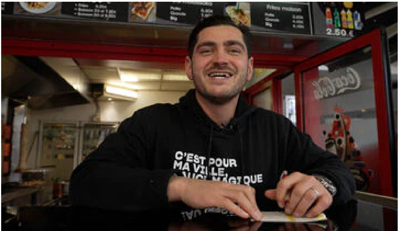
VIDÉO. «On a embauché deux personnes grâce à Orelsan» : le «Magic Beau Gosse» est devenu le kebab le plus célèbre de France