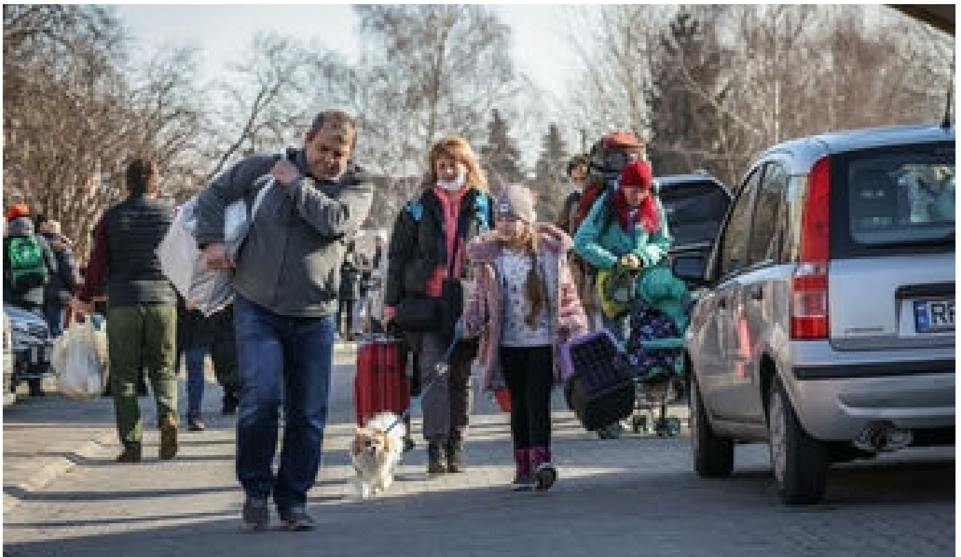
VIDÉO. Guerre en Ukraine : l'angoisse des proches qui attendent des réfugiés aux postes-frontières