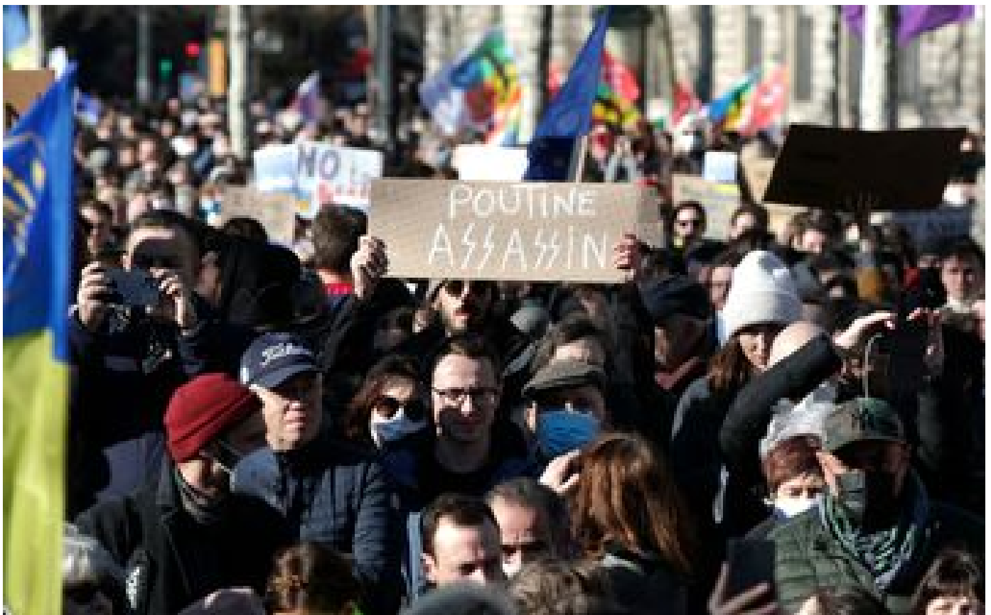
«Stop à la guerre» : des manifestations dans plusieurs villes de France ce samedi, contre l'invasion russe