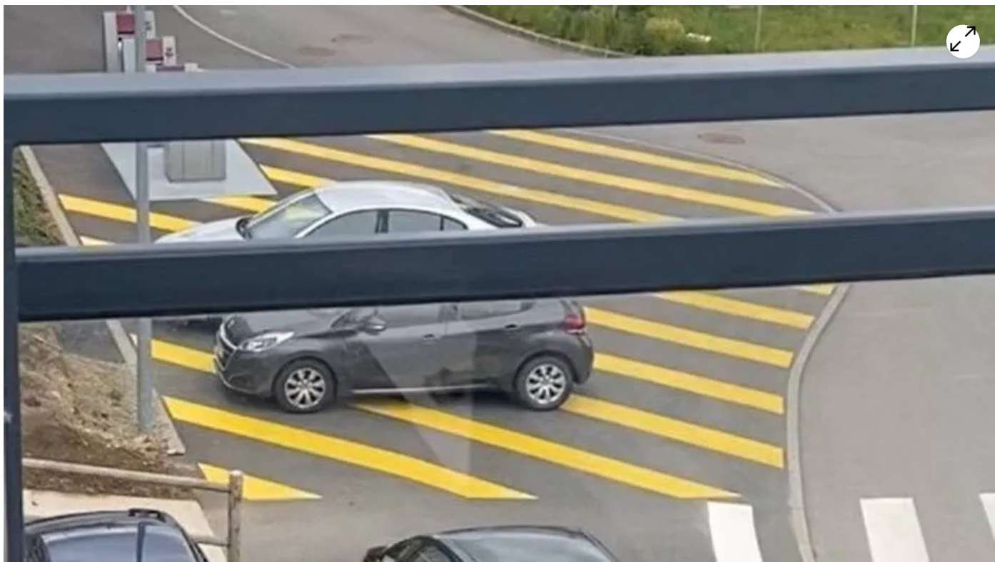
Des riverains de Guipavas (Finistère) ont écopé de trois points sur leur permis de conduire et 135 € d'amende.

Une vingtaine d'habitants de Guipavas, près de Brest (Finistère), ont reçu une contravention salée pour avoir stationné sur un zébra devant chez eux : trois points de permis et 135 € d'amende. Deux contesteront le PV au tribunal.