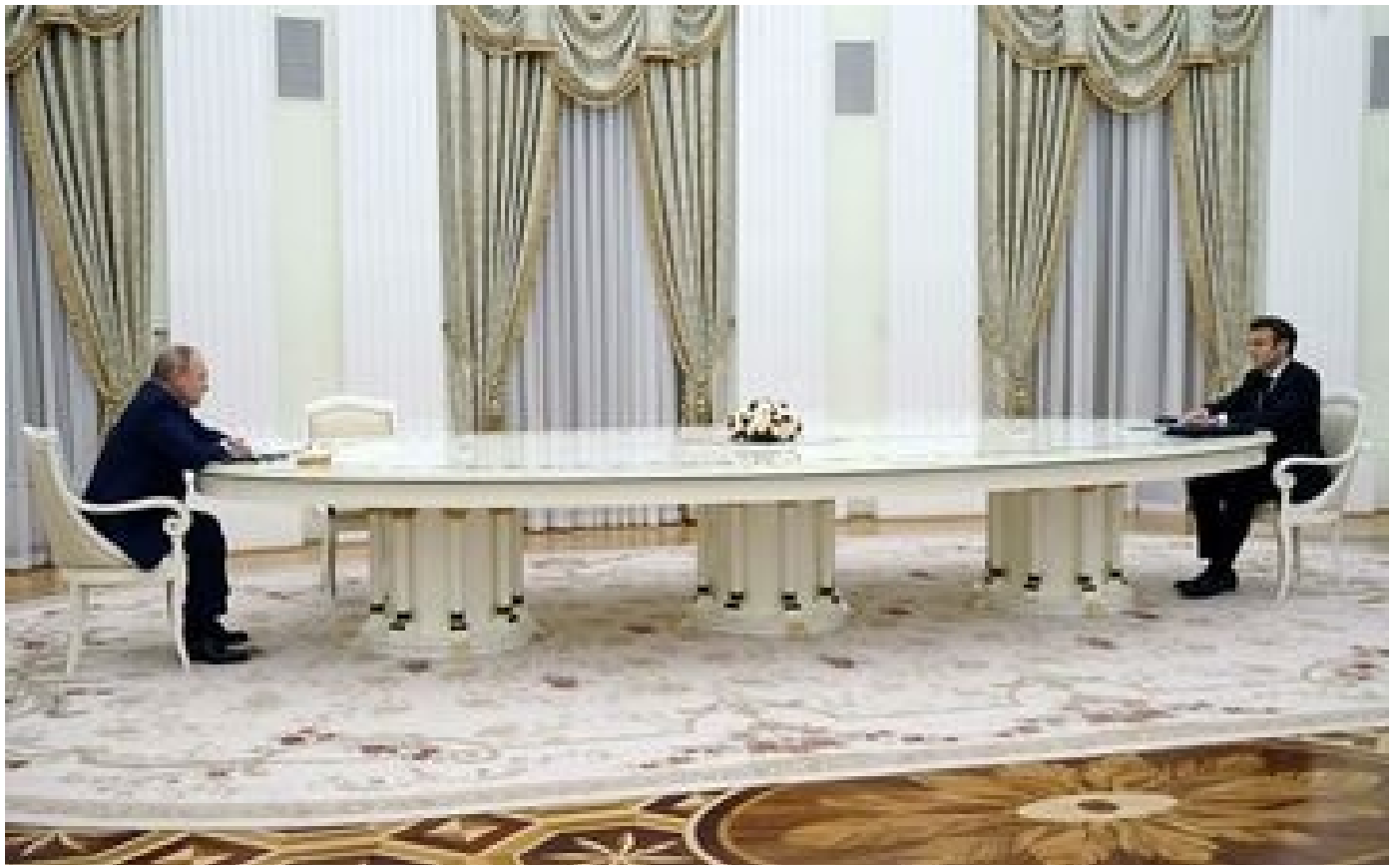
Abonnés Présidentielle : l'international, atout ou boulet pour Emmanuel Macron ?