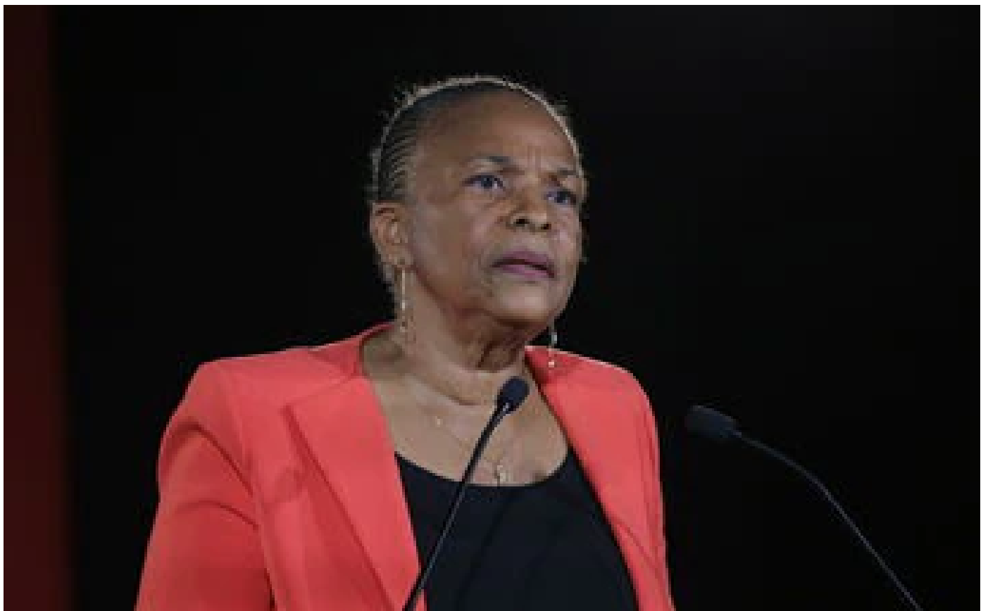
Présidentielle : le PRG se met «en retrait» de la campagne de Christiane Taubira