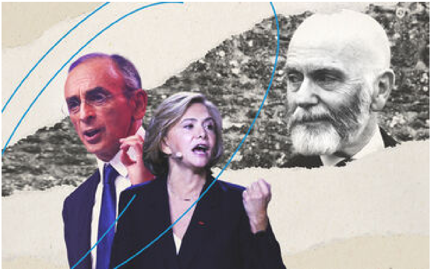
Abonnés «Grand remplacement» : itinéraire d'une expression polémique, de l'extrême droite à Valérie Pécresse