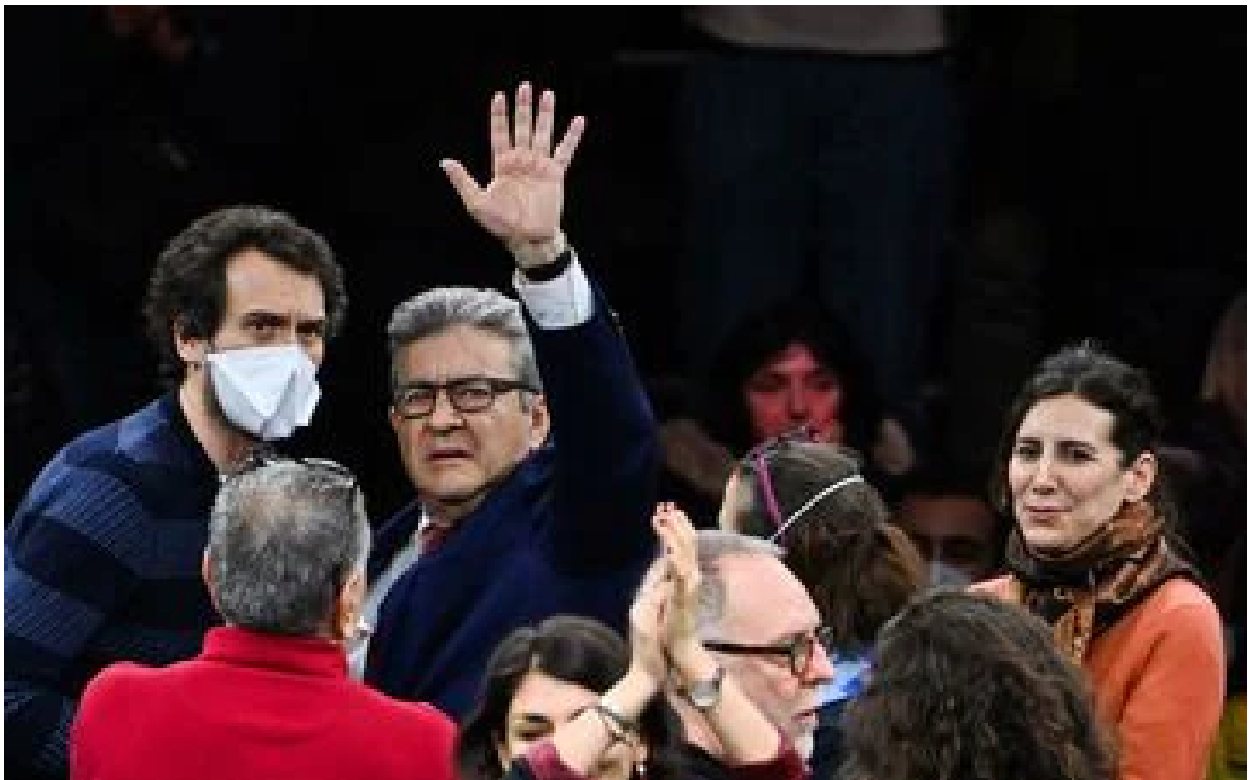
Présidentielle : Jean-Luc Mélenchon peut-il réellement «bloquer tous les prix de première nécessité» ?