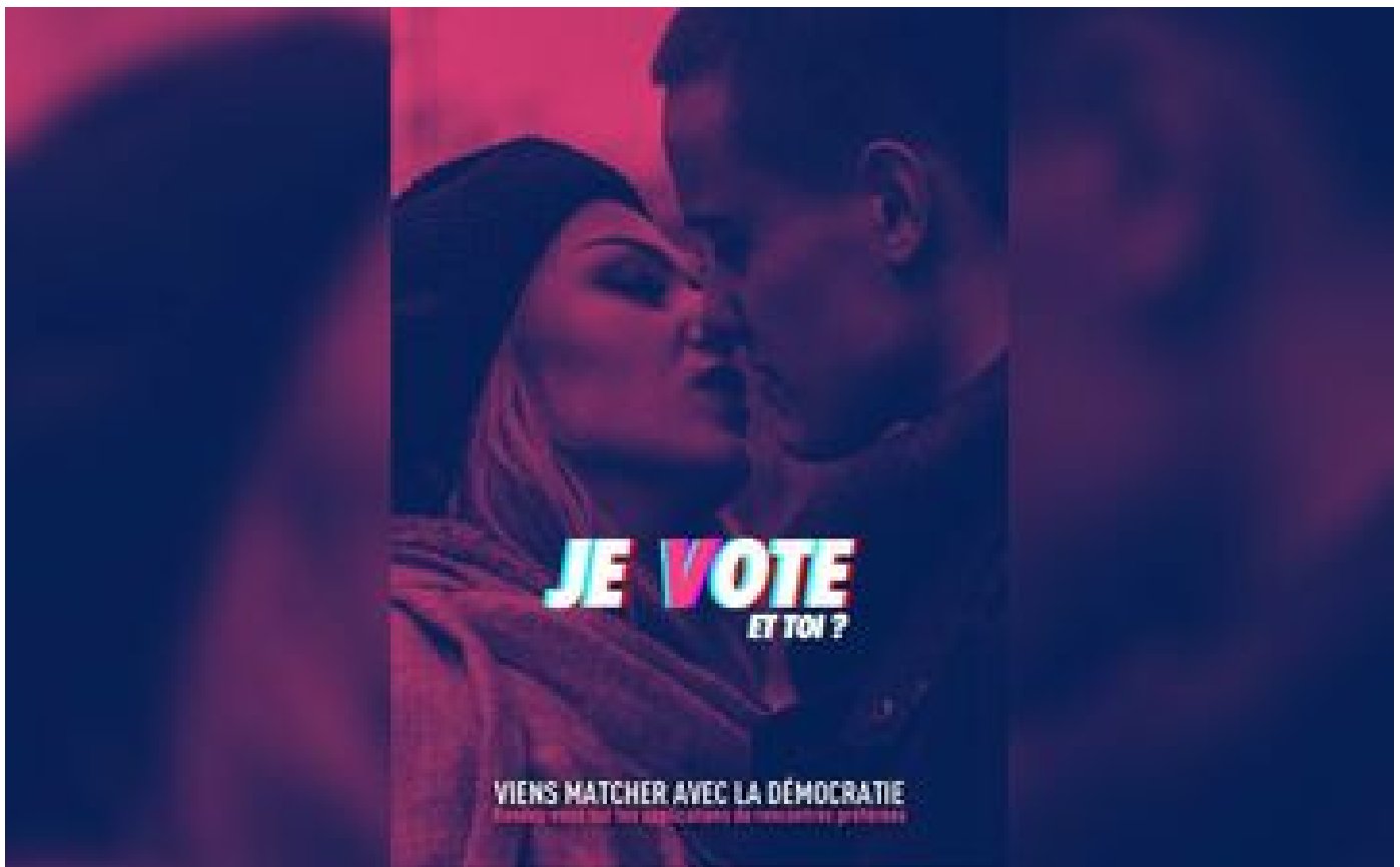
Présidentielle : Tinder s'oppose à une campagne des Jeunes avec Macron sur son application