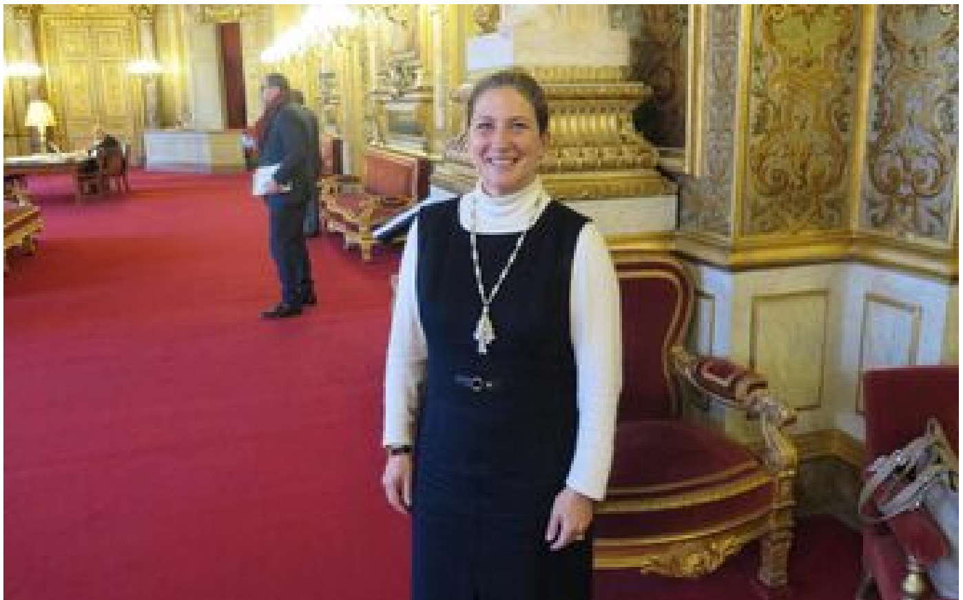
Présidentielle : la patronne des LR de l'Essonne dément avoir été approchée par les équipes de Macron