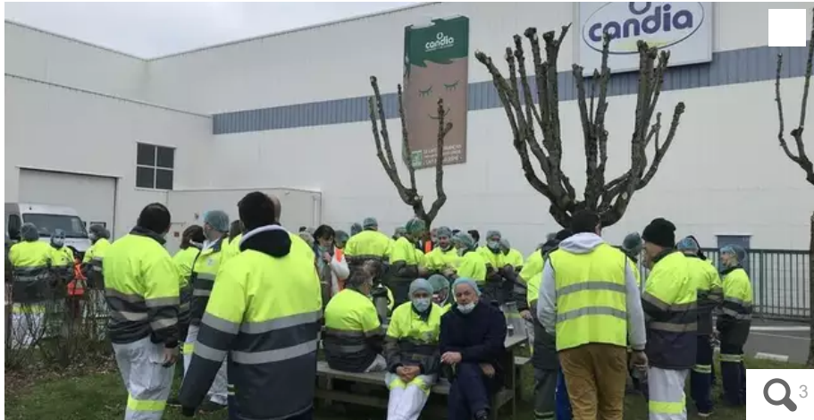
Aucun des 160 salariés de l'historique laiterie de Campbon, n'a souhaité reprendre le travail depuis l'annonce de la fermeture.

Une grosse centaine de salariés occupent l'entrée de l'usine Candia, à Campbon (Loire-Atlantique), depuis ce mercredi matin 2 février. La direction doit préciser son plan de fermeture dans la journée.