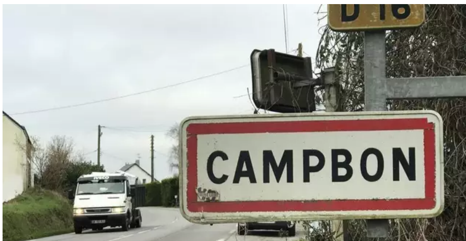
La laiterie est présente à Campbon depuis quatre-vingt-dix ans. C'est le premier employeur de la commune.

L'usine est présente dans la commune depuis près d'un siècle et le coup est sévère aussi pour la vie communale et les commerces. « Ca va être un grand vide », commente Marie, retraitée et née à Campbon.