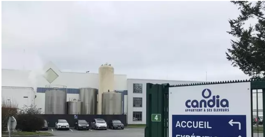
Aucun des 160 salariés de l'historique laiterie de Campbon, n'a souhaité reprendre le travail depuis l'annonce de la fermeture.

L'usine produit 173 millions de litres de lait par an (chiffres 2021). Sodiaal justifie sa décision par un besoin « d'améliorer sa performance économique » et en particulier « son parc industriel de lait UHT et d'ingrédients laitiers infantiles, deux marchés qui souffrent d'une baisse continue des ventes et de surcapacités ».