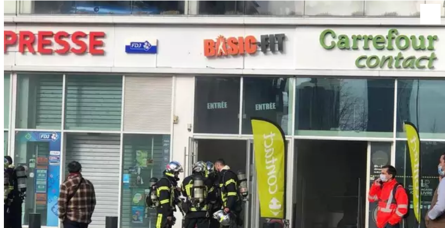
Les pompiers place Rosa-Parks, lundi après-midi.

La place Rosa-Parks sonne vide après l'incendie de véhicules, lundi dans le parking d'un immeuble. De nombreux commerces sont restés fermés depuis.