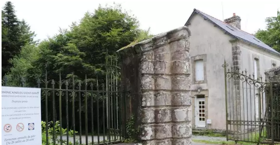
L'institut des dominicaines du Saint-Esprit, dont la maison mère est à Berné a reçu les « excuses » du pape François, reconnaissant les défaillances de la Curie romaine.