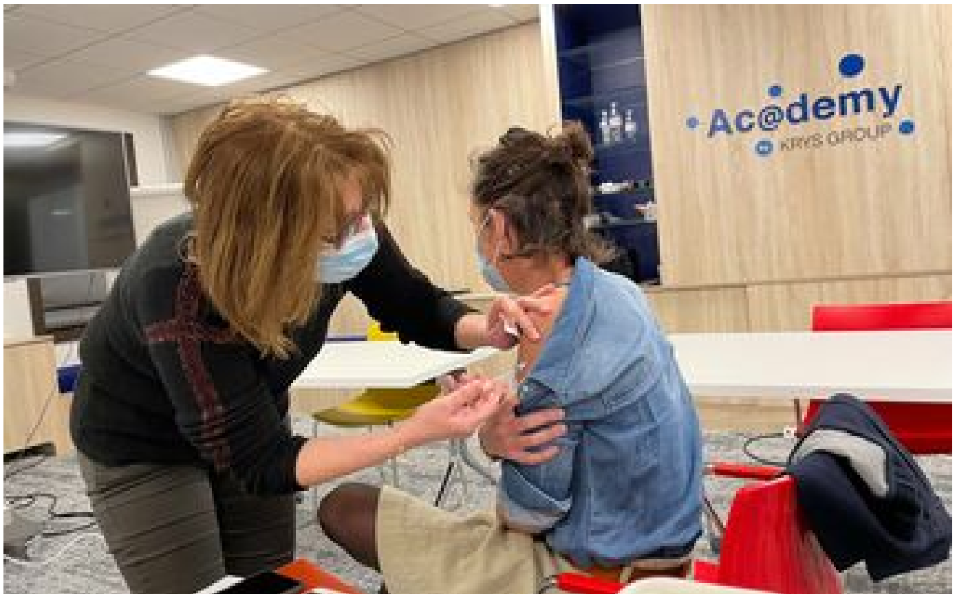
Abonnés Vaccination en entreprise : «Cela évite de perdre une demi-journée de travail !»