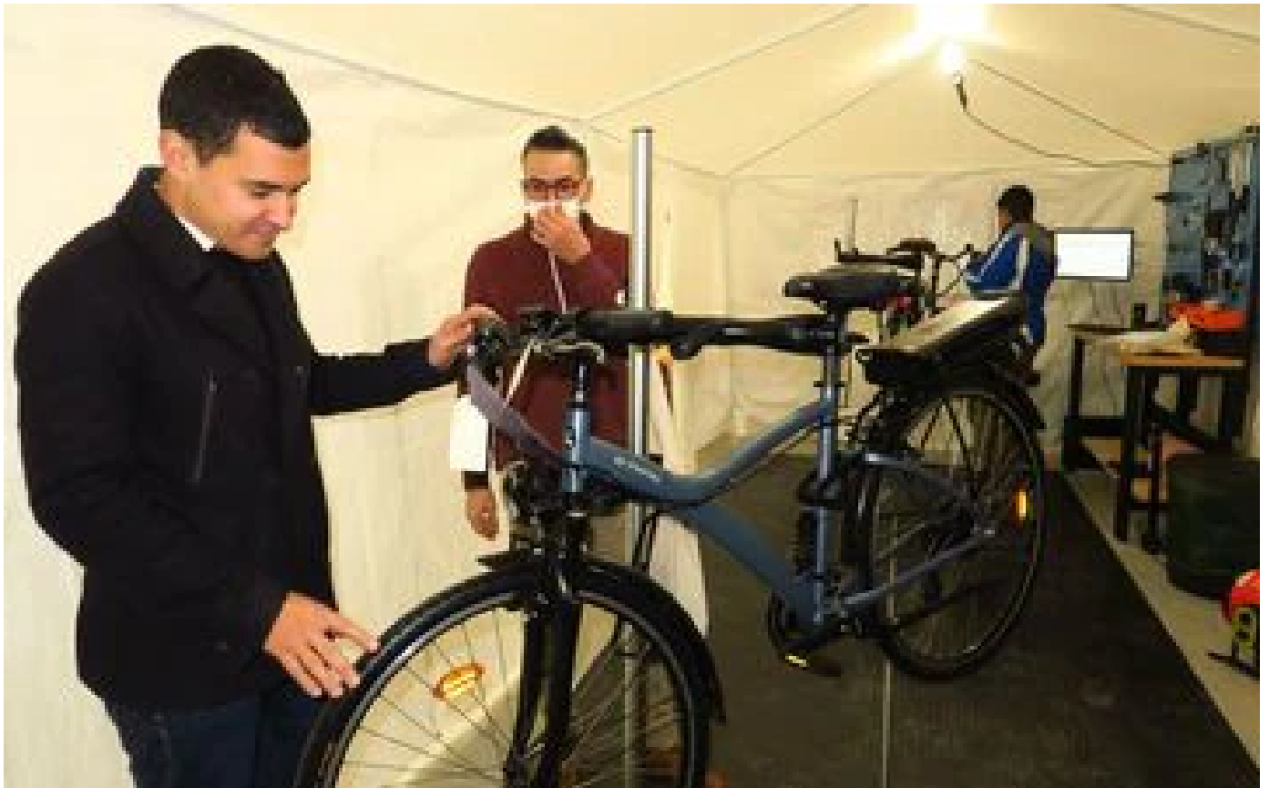
Abonnés Gennevilliers : ils se lancent sur le marché de la seconde vie des vélos électriques