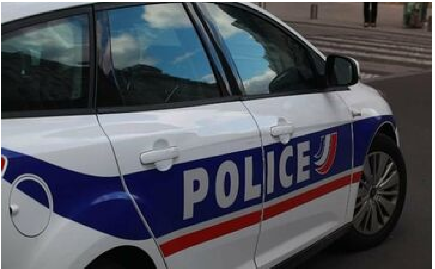
Gennevilliers : il laisse un autre client de l'hôtel de la Plage mourir de crise cardiaque sans intervenir et finit en garde à vue