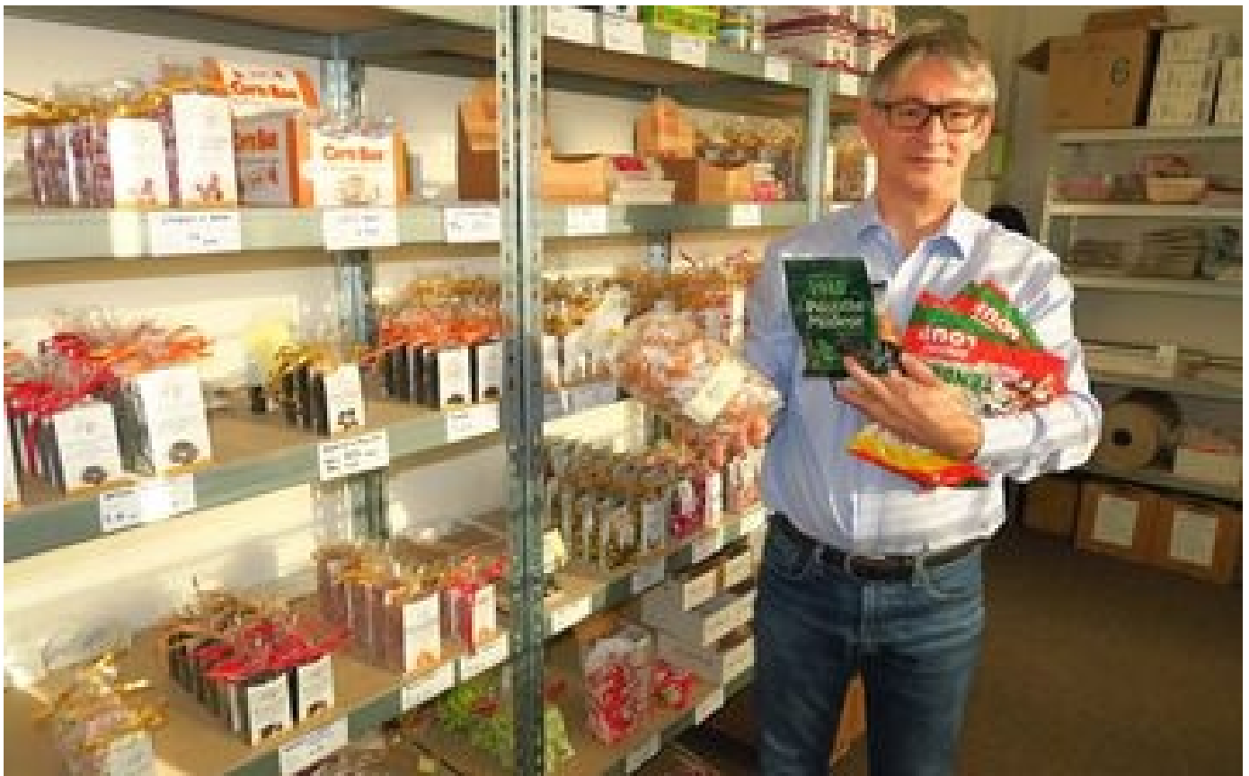
Abonnés Nougat, chardon lorrain, guimauve... cette start-up vend des confiseries historiques depuis Gennevilliers