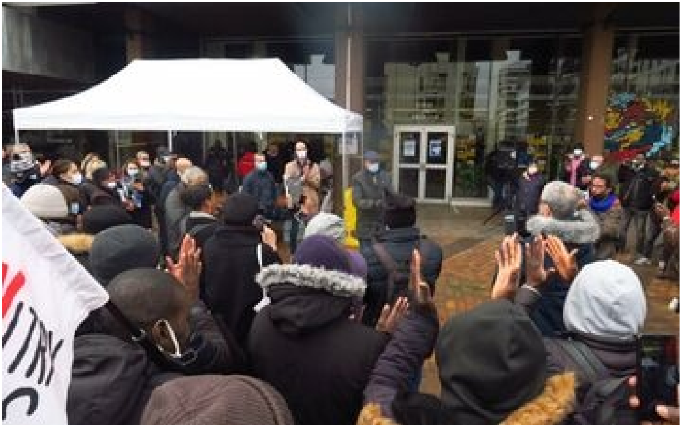
Abonnés Travailleurs sans-papiers grévistes de Gennevilliers : un barbecue solidaire pour entretenir la flamme du combat