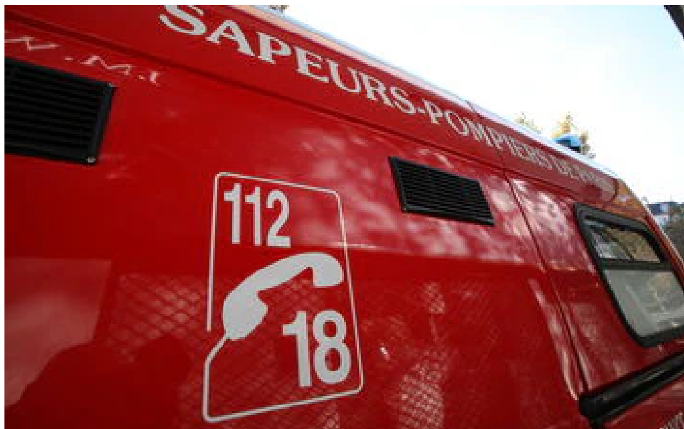
Gennevilliers : l'Audi percute le camion-poubelle, un éboueur perd une jambe dans l'accident