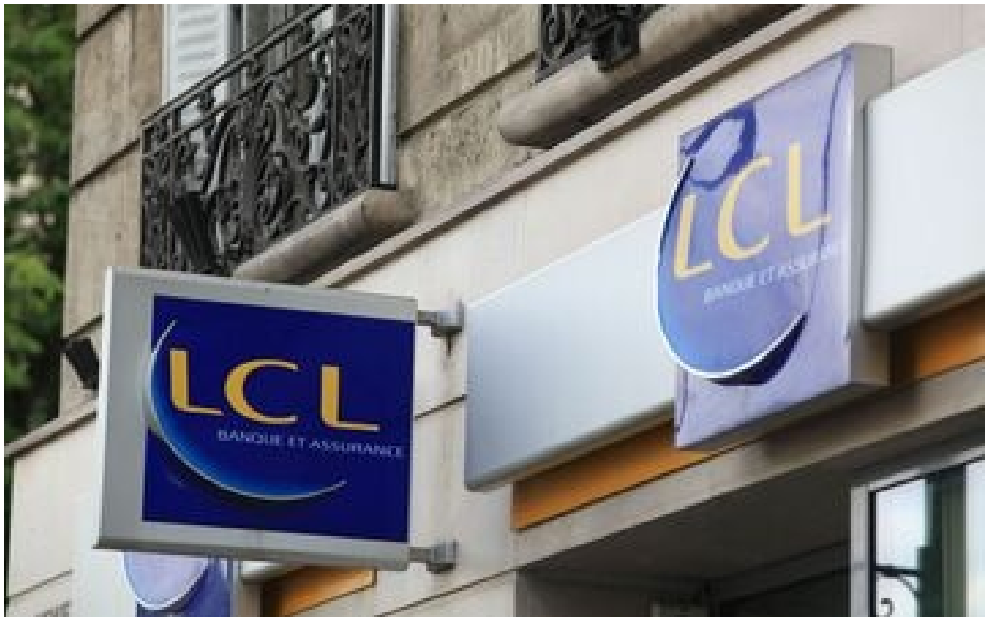
Abonnés Hauts-de-Seine : surendettée, une banquière vole 60000 euros à un client et à LCL