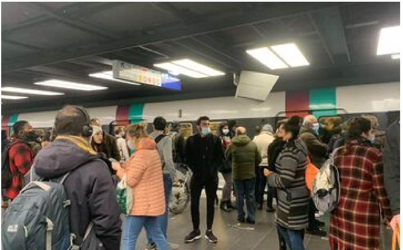
Abonnés Retards à répétition : les usagers du RER B devraient être indemnisés