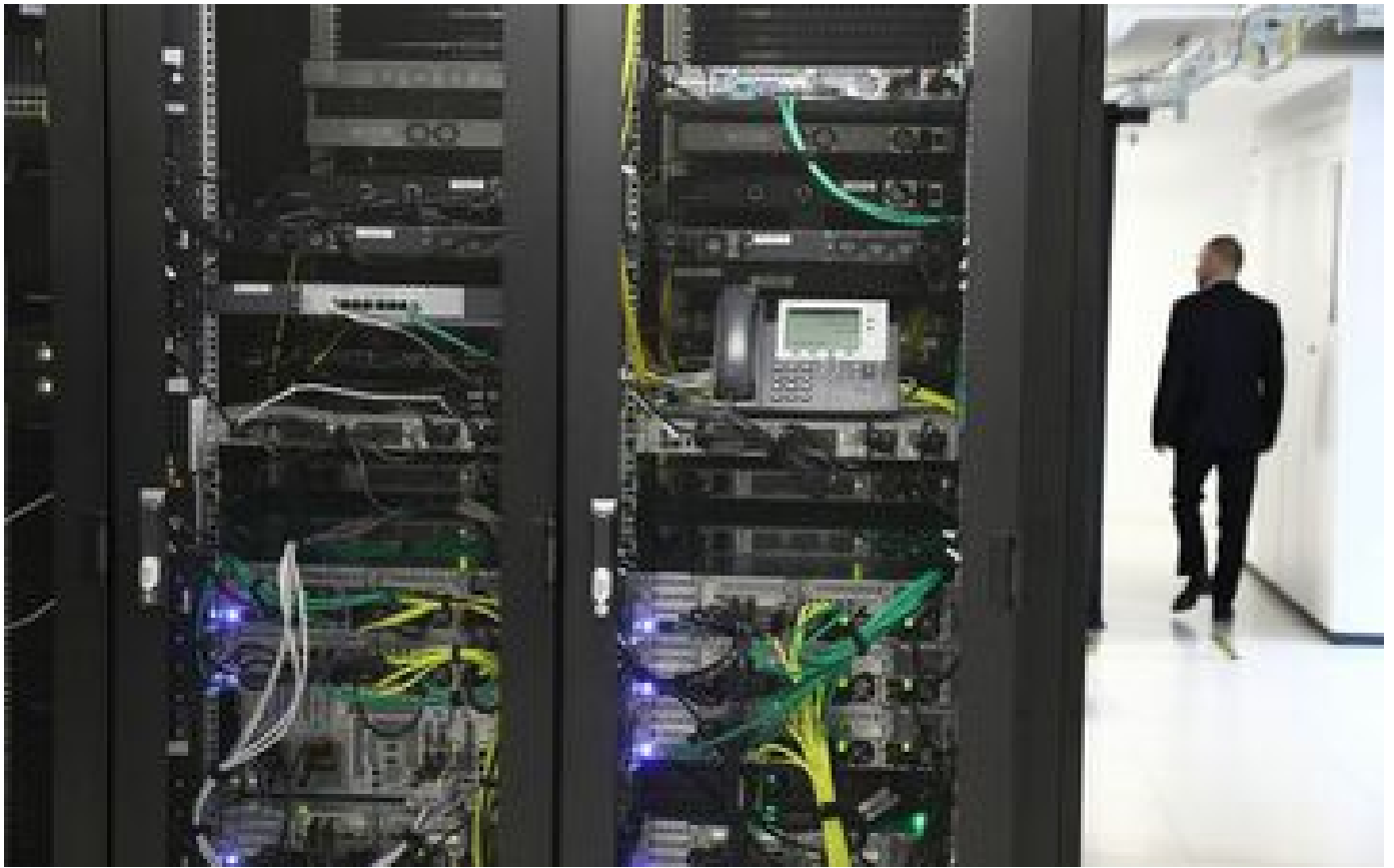
Abonnés Les villes d'Île-de-France face à une déferlante de cyberattaques