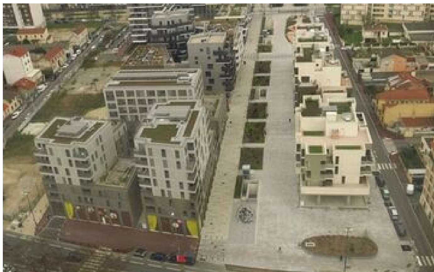
Logements par centaines, commerces de proximité, jardins partagés : Gennevilliers se dote d'un «vrai» centre-ville