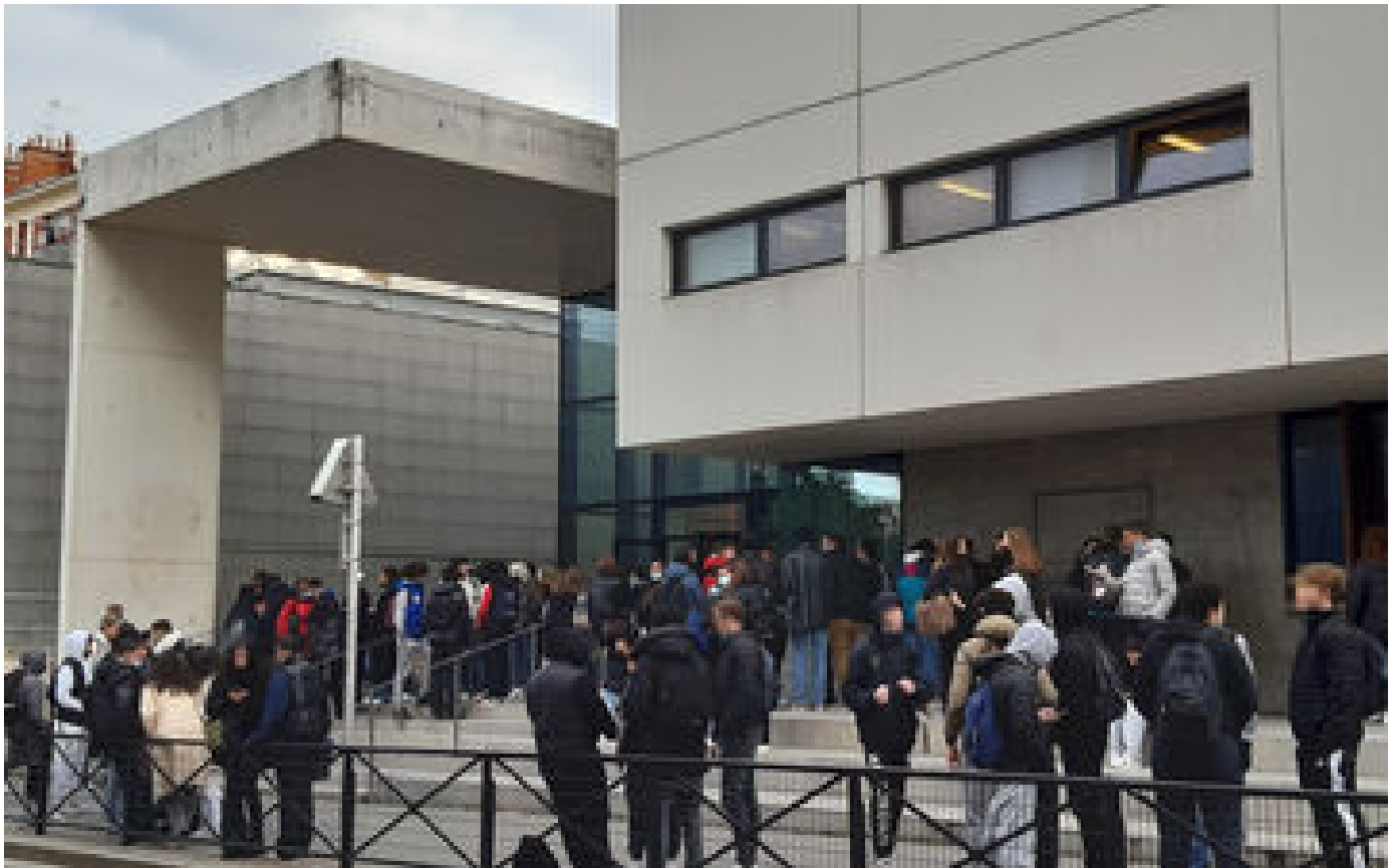
Abonnés Boulogne-Billancourt : des élèves de première spécialisés en gestion privés de cours de... gestion depuis septembre