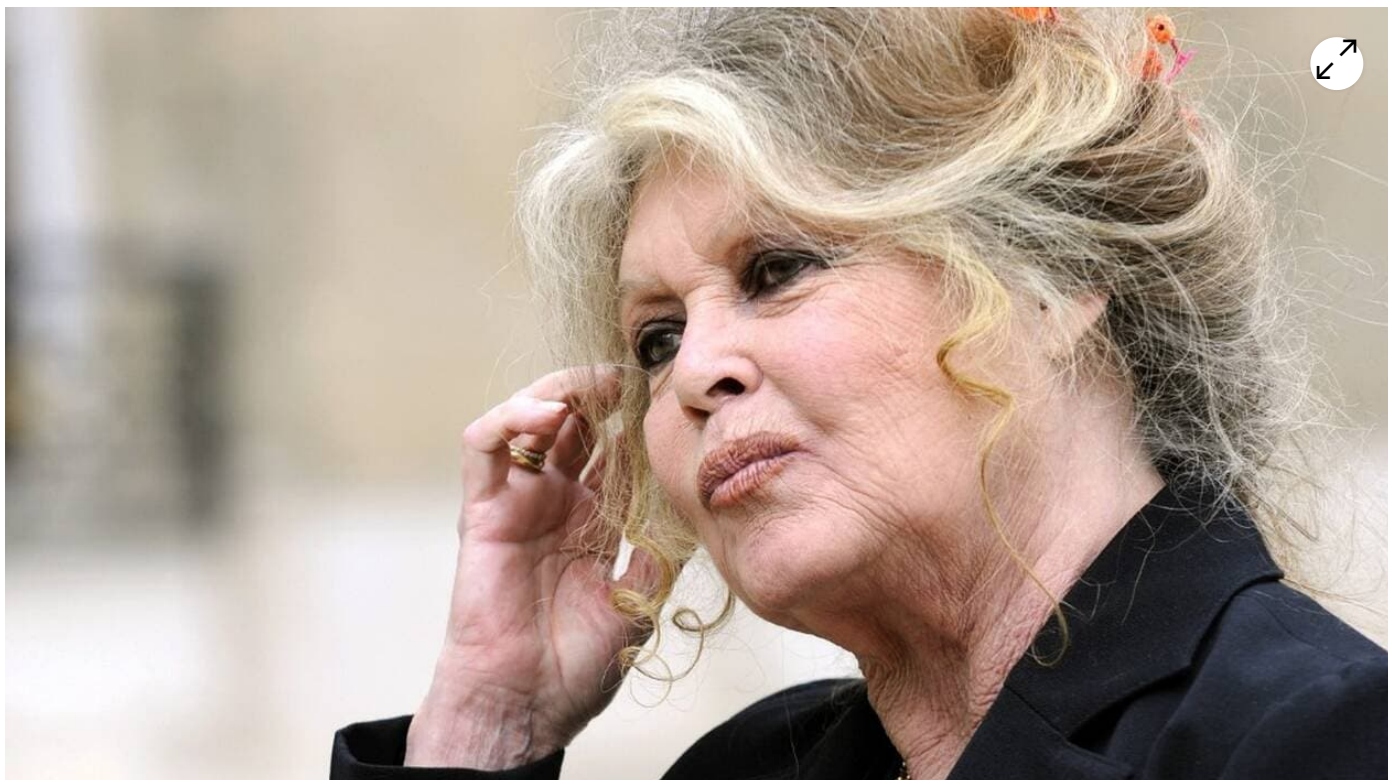
Brigitte Bardot, en septembre 2007 à l'Élysée.

Se disant « allergique à tous les produits chimiques », l'actrice Brigitte Bardot explique qu'elle ne veut pas se faire vacciner contre le Covid-19.