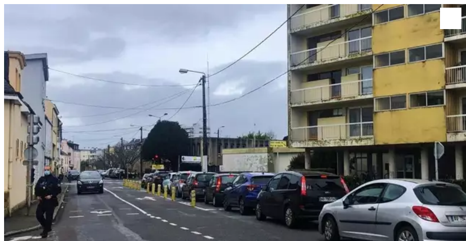
Le drive Covid, installé rue François-Le Levé dans l'ancienne caserne des pompiers de Lorient, devrait déménager.

A compter de ce mercredi 5 janvier 2022, le drive Covid, installé rue François-Le Levé à Lorient (Morbihan), ne sera ouvert que le matin, de 8 h à 12 h 30.