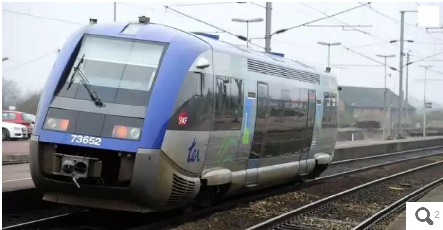
Pour lancer sa première ligne entre Bordeaux et Lyon, Railcoop a racheté d'anciens TER.

Avec l'ouverture du transport ferroviaire à la concurrence, la société coopérative Railcoop envisage de lancer une dizaine de lignes voyageurs en France. Plusieurs passent par l'Ouest, comme Nantes-Lille ou Le Croisic-Bâle, en Suisse. Les premiers trains ne sont pas attendus avant 2024, au plus tôt.