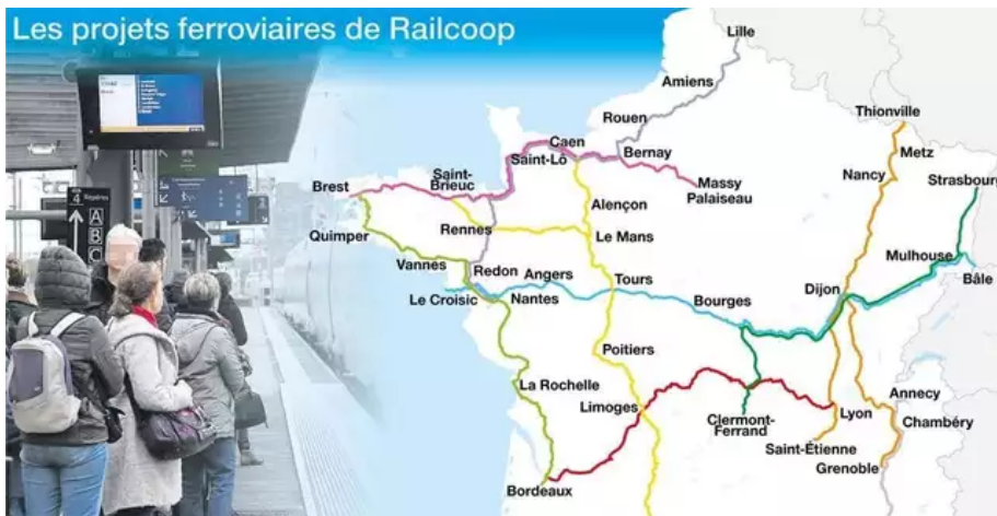
Les lignes ferroviaires que Railcoop envisage d'exploiter, en France.

Dans ses cartons, plusieurs projets concernent le nord-ouest de la France. Les lignes Brest-Massy , Nantes-Lille et Le Croisic-Bâle (Suisse) viennent ainsi de recevoir un avis favorable de l'Autorité de régulation des transports (ART), qui avait été saisie pour avis par les Régions Normandie et Bourgogne.