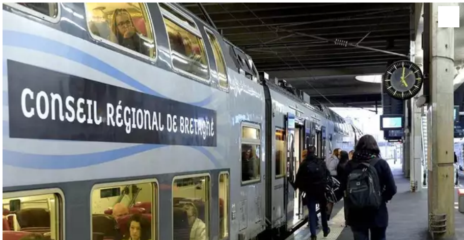
Deux allers-retours Quimper-Lorient ont été supprimés ce lundi 3 janvier 2022.

Deux allers-retours Quimper-Lorient de TER ont été supprimés ce matin, lundi 3 janvier 2022 après qu'un conducteur ait été testé positif au covid-19. Les voyageurs ont été reportés sur les TGV suivants