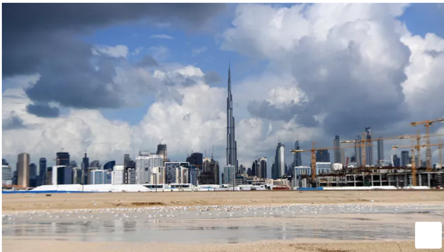
Dubaï sous un ciel menaçant.

EN IMAGES - Les autorités de plusieurs pays du Golfe ont multiplié dimanche les alertes à destination de leurs résidents en raison des pluies qui s'abattent depuis plusieurs jours sur cette région très chaude et aride.