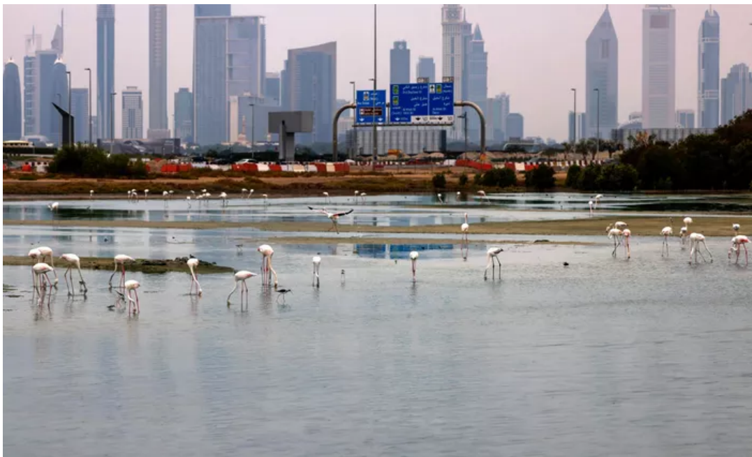
Des flamants roses à Dubaï après de fortes précipitations le 2 janvier.

À Sharjah, un autre émirat de ce riche État, des passants et des véhicules ont été pris dans les eaux marron. Les autorités n'ont pas fait état de victime.