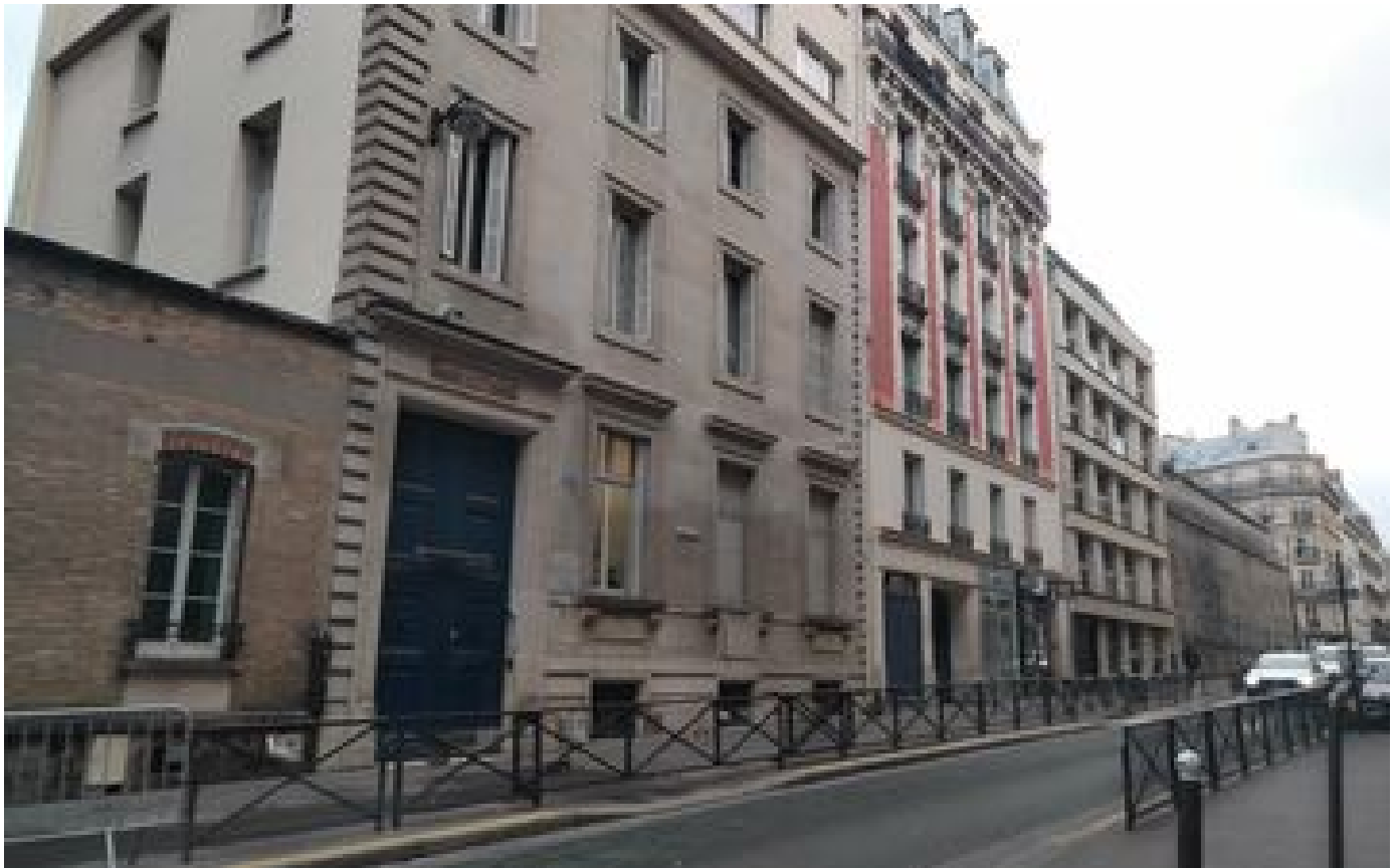
Abonnés Paris : la façade historique de la synagogue Copernic condamnée par la modernisation