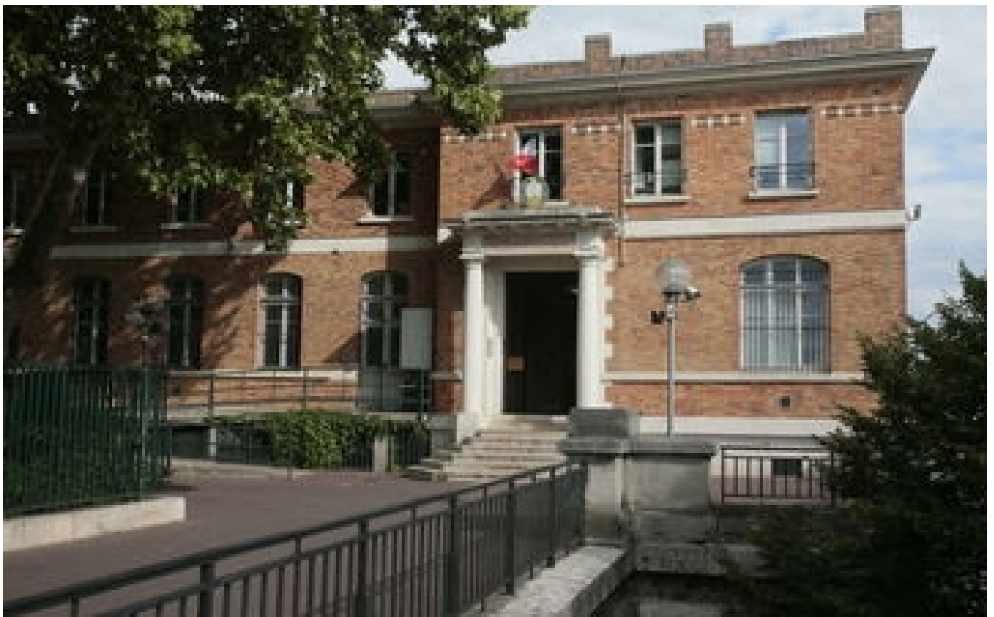
Abonnés Le rapport au vitriol sur l'Institut médico-légal de Paris a-t-il été enterré ?