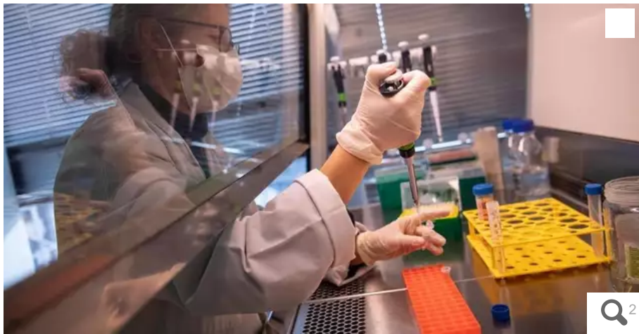
La biotech nantaise a déjà fabriqué 25 000 doses prêtes à l'emploi de son traitement anti-Covid Xav-19.

La biotech nantaise Xenothera annonce les premiers résultats d'efficacité in vitro de son anticorps polyclonal anti-Covid contre le variant Omicron. Et interpelle le gouvernement afin que son traitement soit rapidement mis à la disposition des patients qui en ont besoin.