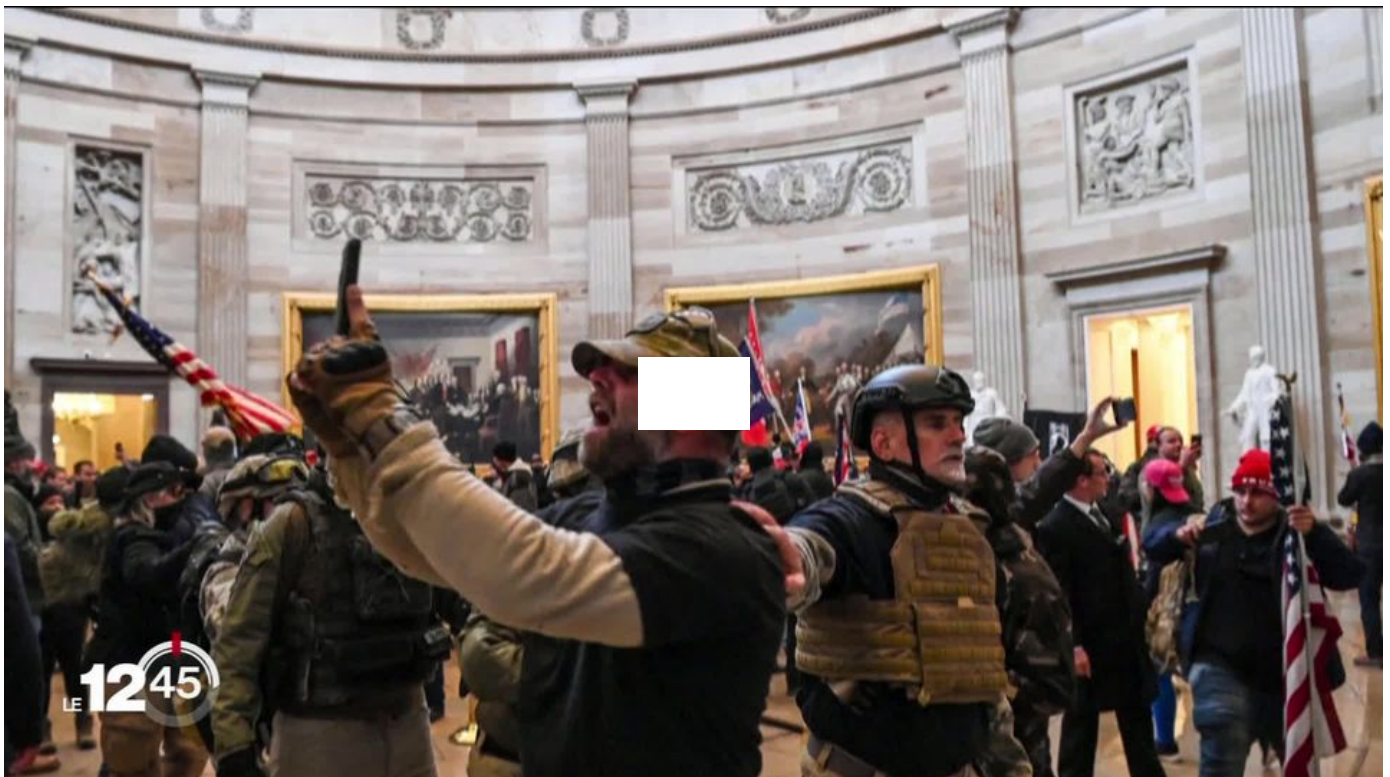
Chaos et consternation aux Etats-Unis après l'attaque du Capitole à Washington par les partisans de Donald Trump. / 12h45 / 2 min. / le 7 janvier 2021

>> A regarder, l'épisode de l'attaque du Capitole, en mars 2021: