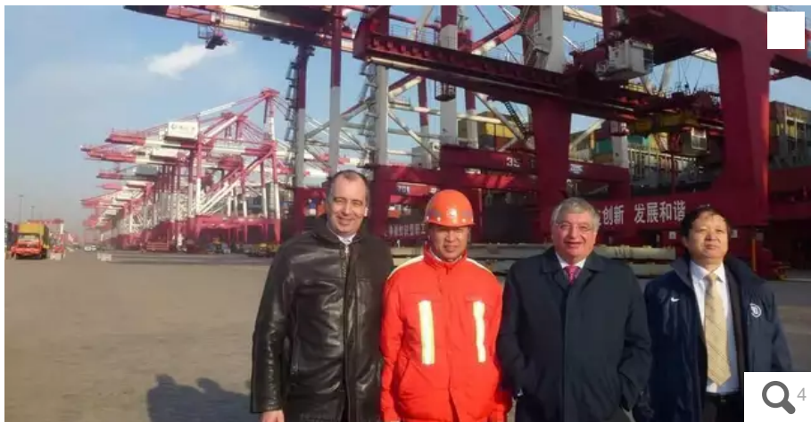
Jacques Auxiette est allé en Chine « chasser en meute », comme il aimait à dire, en véritable VRP des entreprises ligériennes.

Quel héritage laisse Jacques Auxiette à la région Pays de la Loire ? Difficile de résumer onze ans de présidence en quelques lignes. Retour sur six temps forts d'un président de Région « à 100 % », dans l'action sur le terrain.