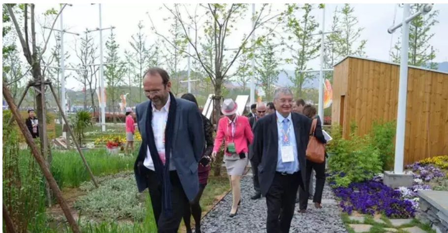
Le 25 avril 2014, Jacques Auxiette inaugurait le pavillon des Pays de la Loire à l'exposition internationale de l'horticulture de Qingdao, en Chine. Seul représentant de la France, l'espace régional entendait bien être la vitrine de ses entreprises. Le fruit de liens tissés de longue date.