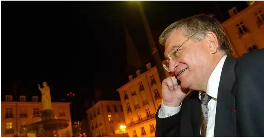
Le 28 mars 2004, Jacques Auxiette est un homme politique heureux : il fête sa victoire ? aux élections régionales et cantonales, place Royale, à Nantes.