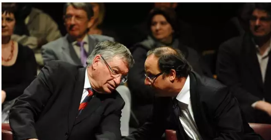
Le 10 mars 2010, François Hollande venait soutenir Jacques Auxiette à Nantes?, alors président sortant et candidat PS aux élections régionales?.