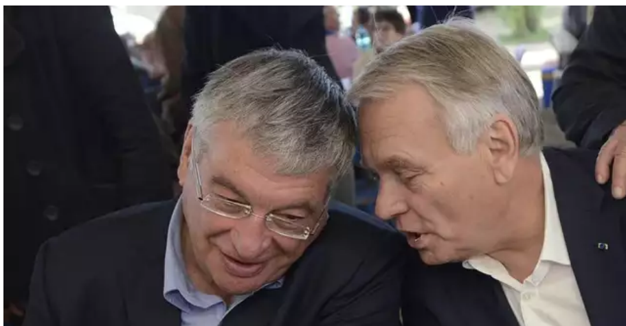
Le 15 septembre 2013, la Fête de la rose du parti socialiste, à Préfailles (Loire-Atlantique) lançait la campagne des municipales 2014. Jean-Marc Ayrault, Premier ministre à l'époque, et Jacques Auxiette appelaient au rassemblement de la gauche contre la menace des alliances entre la droite classique et le FN.