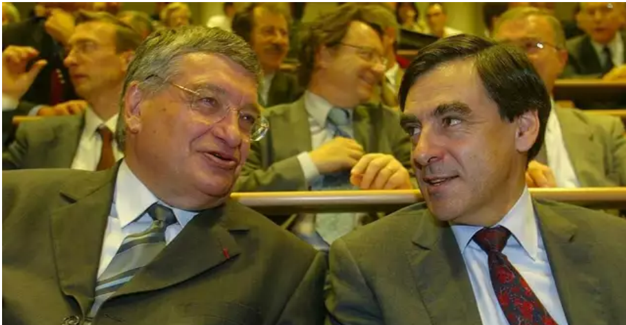
Le 30 septembre 2004, lors du lancement du projet Cyclotron, à Nantes, un équipement de recherche médicale pour la lutte contre le cancer. Jacques Auxiette, confirmait un « engagement de la région, déterminé, définitif ». À ses côtés, François Fillon, alors ministre de l'Éducation nationale et de la Recherche. ? © Archives Franck Dubray / Ouest-France