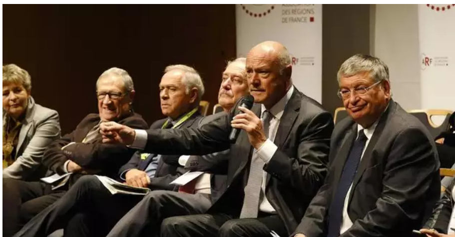
Le 19 septembre 2013, lors du congrès de l'Association des régions de France, à la cité des congrès, de Nantes, Jacques Auxiette militait pour une nouvelle donne en matière ferroviaire. Au micro, Alain Rousset.