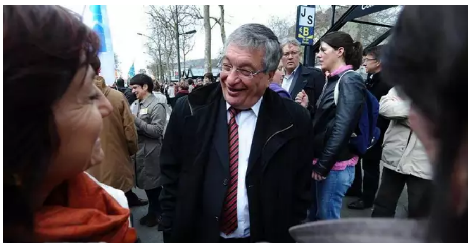
Le 23 mars 2010, Jacques Auxiette participait à la journée d'action interprofessionnelle pour protester contre la politique du gouvernement et la baisse du pouvoir d'achat. Environ 9 000 personnes manifestaient dans les rues de Nantes (Loire-Atlantique).