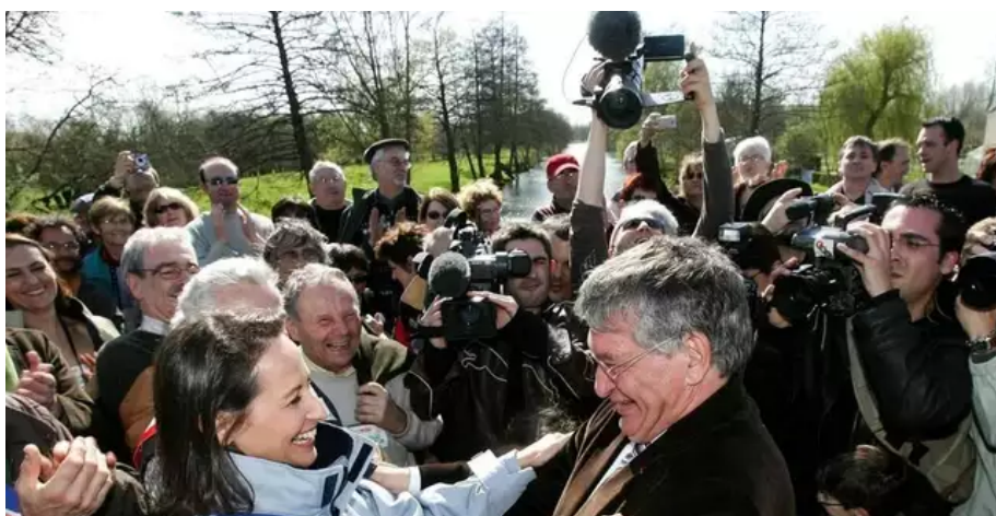
Samedi 29 mars 2008, entre Vendée et Deux-Sèvres, citoyens et élus se mobilisaient en faveur de la labellisation « parc naturel régional » du Marais poitevin. La marche citoyenne? a rassemblé entre 4 000 et 5 000 personnes. En tête des cortèges, Ségolène Royal, pour le Poitou-Charentes et Jacques Auxiette, pour les Pays de la Loire.