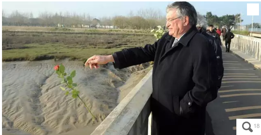
Le 6 mars 2011, Jacques Auxiette rendait hommage aux disparus de la tempête « Xynthia », à La Faute-sur-Mer (Vendée).

Le socialiste, ancien maire de La Roche-sur-Yon (Vendée) et ancien président de la Région des Pays de la Loire, est décédé vendredi 10 décembre. Retour en image sur le parcours de cet homme modeste, qui n'avait oublié ni ses origines familiales ni ses valeurs politiques.