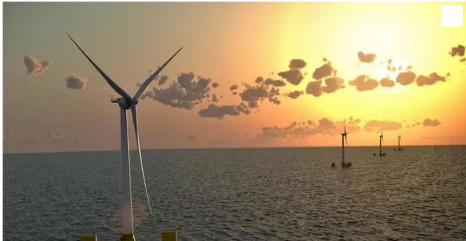
S'agissant du dossier de parc éolien au large de Groix, Plœmeur est concernée par le raccordement à terre.

Une réunion de concertation concernant le projet de parc éolien au large de Groix s'est tenue ce mardi 30 novembre 2021, à la préfecture de Vannes (Morbihan). Plœmeur est concernée par un raccordement à terre.