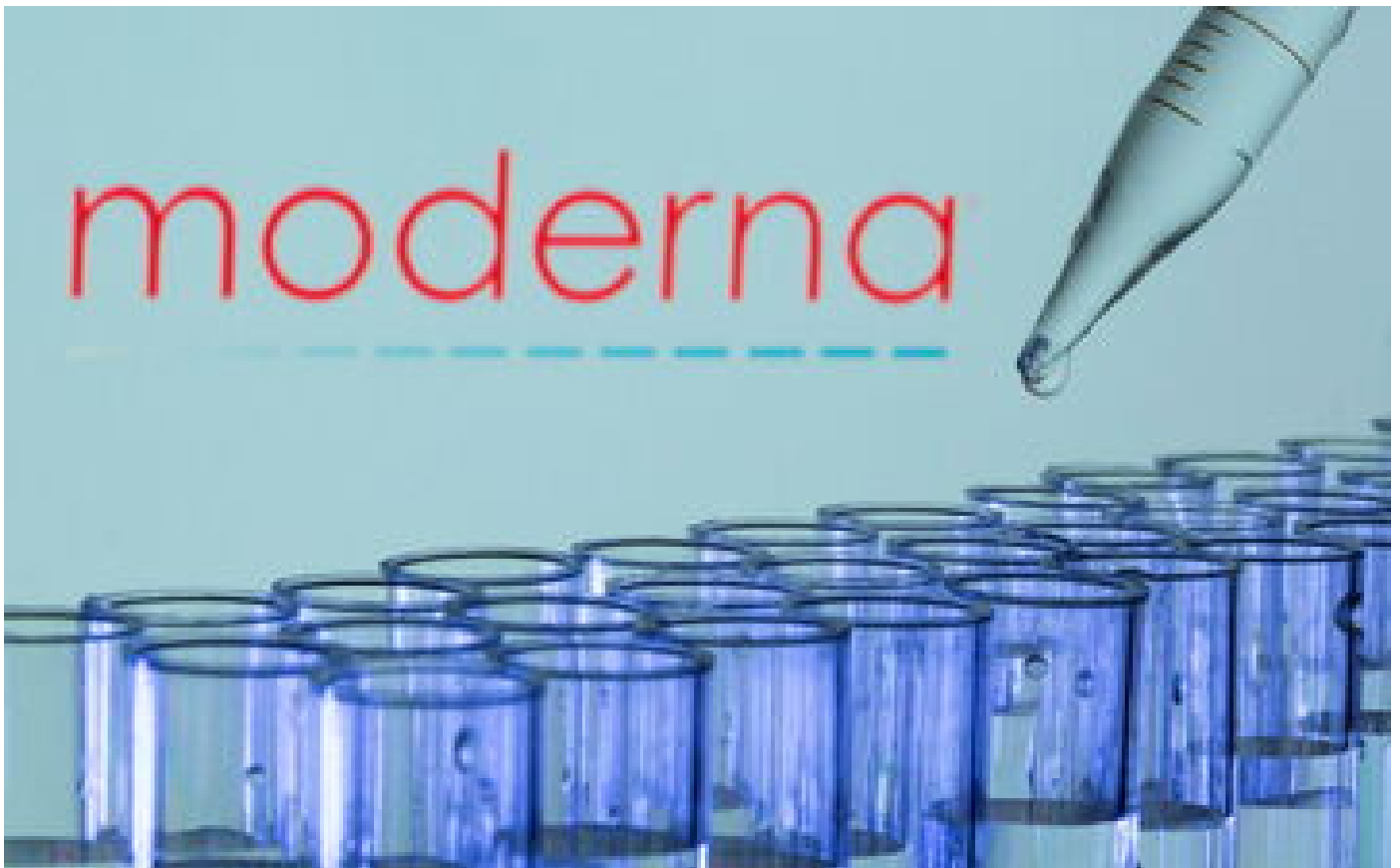
Nouveau variant Omicron : Moderna entend mettre au point un vaccin spécifique