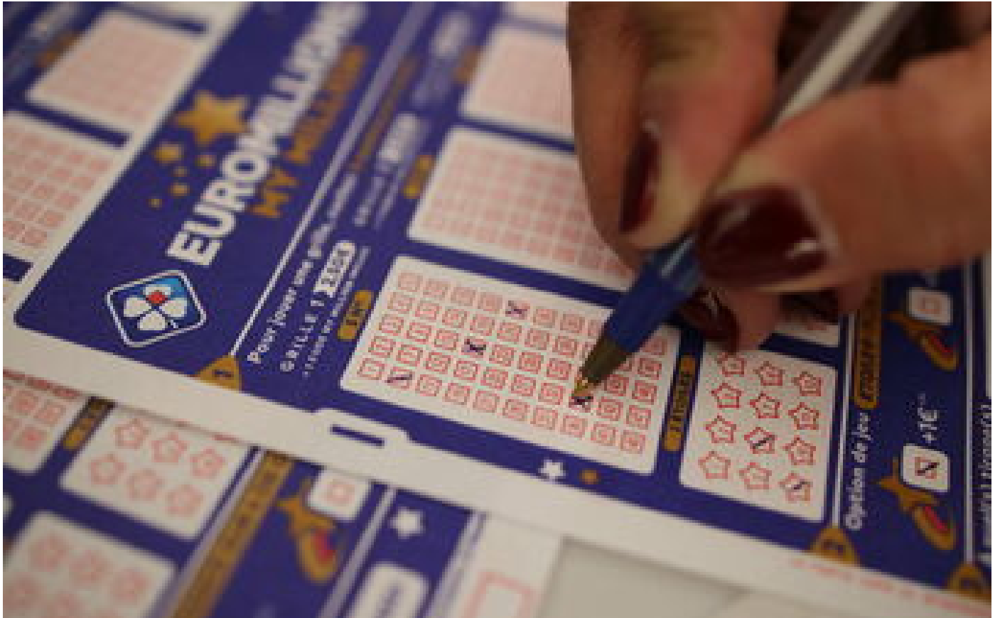
EuroMillions : encore un gagnant français d'un jackpot géant, qui décroche 162 millions d'euros !