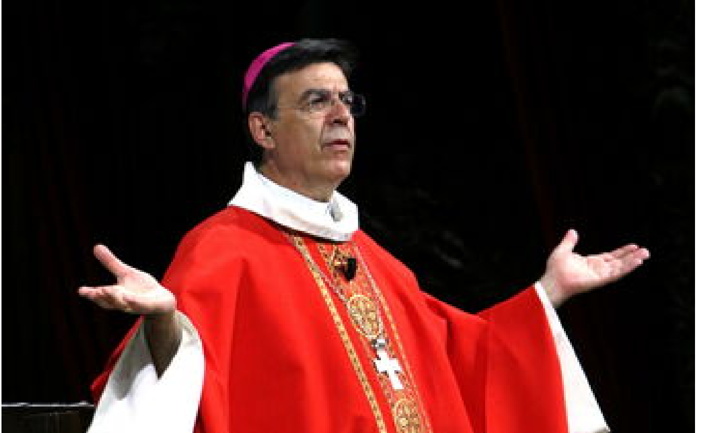
Abonnés Démission de l'archevêque de Paris : les coulisses d'un scandale