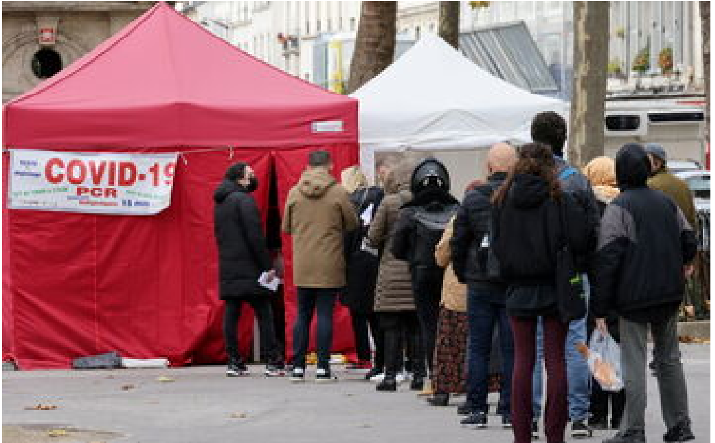
Variant Omicron : aucun cas détecté en France, mais un risque «élevé à très élevé» qu'il se répande en Europe