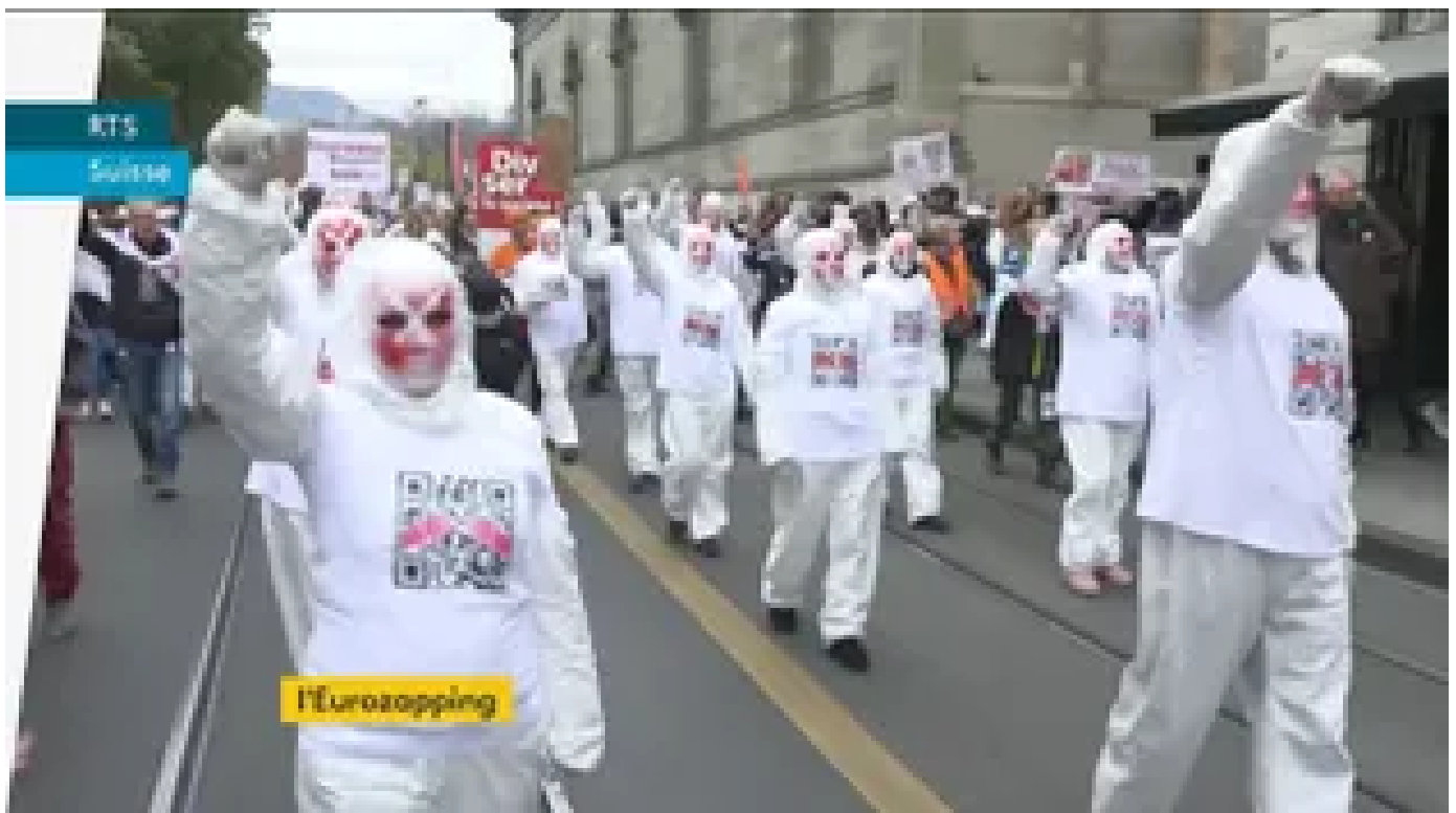
Eurozapping : manifestations en Suisse et en Belgique ; pas de TGV pour le nord de l'Angleterre