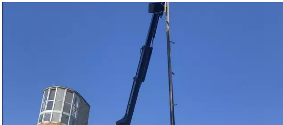
Lors de l'opération de changement de support d'éclairage public.