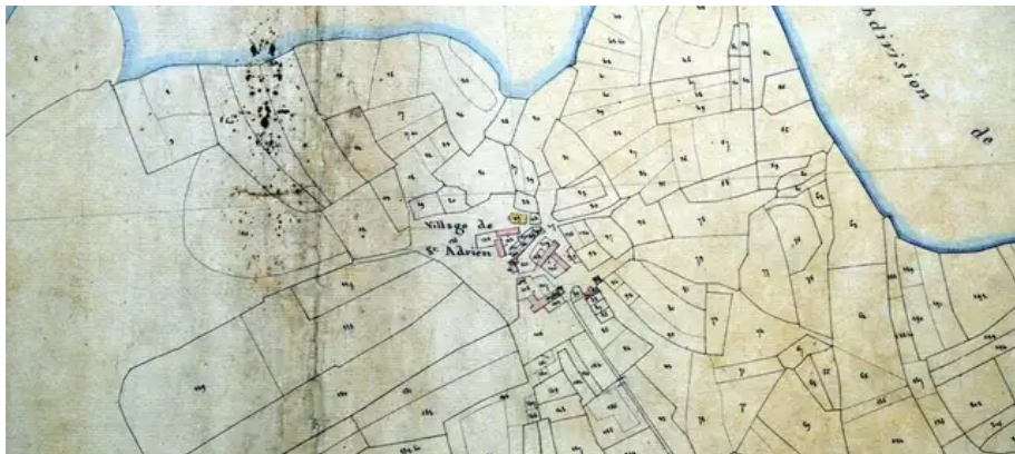
Sur le cadastre Napoléonien, près de 300 dénominations, majoritairement en Breton, concernent le village de Saint-Adrien et ses environs.

« Cet article a vu le jour un peu grâce au confinement, explique Pierre Hamon passionné d'histoire mais aussi de langue bretonne. Disposant de plus de temps, j'ai pu m'atteler à la traduction des dénominations figurant sur le cadastre car 95 % d'entre elles sont en breton. Pour Saint-Adrien et les alentours, cela correspond à près de 300 dénominations. La traduction n'est pas toujours simple car il s'agit d'un breton local plutôt oral. »