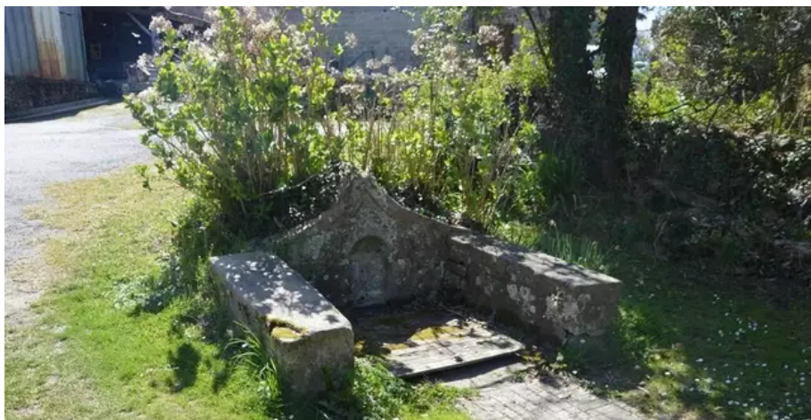
Une des deux fontaines encore visibles à Saint-Adrien.

« Même si beaucoup d'éléments ont disparu, la configuration des lieux n'a pas tellement changé. On s'y retrouve, expliquent les auteurs. Les deux fontaines sont encore présentes (une sur un commun de village, l'autre sur un terrain privé). En revanche, seules quelques pierres subsistent de la chapelle. Et le pont Saint-André, qui existait entre Saint-Adrien et Lannec permettant de relier Kergoat et le Cruguellic, est désormais sous l'eau. »