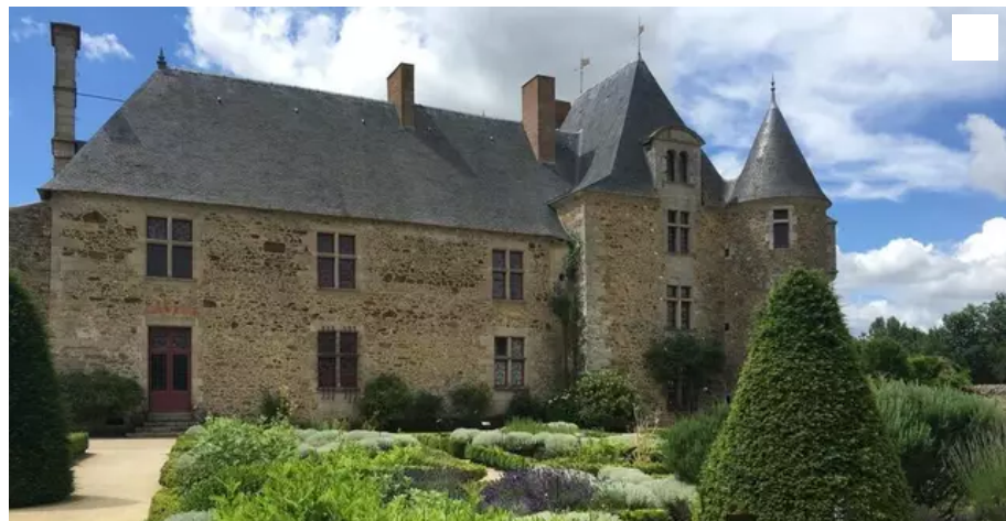
Le Logis de la Chabotterie et son parc vont accueillir les prochaines Floralies internationales.