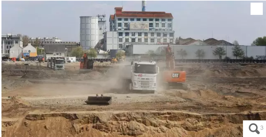
Les travaux de terrassement du futur CHU de Nantes sont en cours sur le site de l'ancien MIN, sur l'île de Nantes.

Le contrat de maîtrise d'œuvre pour la construction du futur CHU de Nantes passé en 2014 avec le groupement Art & Build architectes, Pargade architectes, Artelia et Signes Paysages, a été résilié en mars. En cause : un désaccord de fond sur le coût de l'opération, jugé sous-évalué.