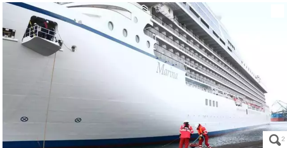
Le paquebot Marina (240 m de long) a accosté au port de commerce de Lorient ce lundi 27 septembre 2021. Une escale à la journée.

Avec la crise sanitaire, le monde de la croisière a dû jeter l'ancre. L'accostage du Marina, ce lundi 27 septembre 2021 à Lorient (Morbihan), annonce la reprise de l'activité.