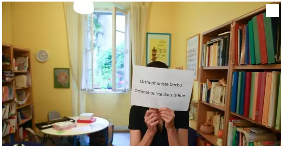
Refusant de se faire vacciner, l'orthophoniste nantaise a fermé son cabinet.

Persuadée qu'avec le vaccin contre le Covid-19, elle met sa propre santé en danger, cette professionnelle a choisi de fermer son cabinet, après vingt-cinq ans d'exercice comme orthophoniste. Sous couvert d'anonymat, elle a accepté de témoigner.