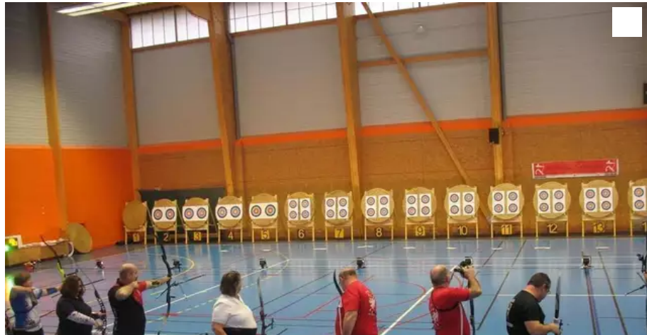
La section tir à l'arc de l'Asal, qui doit quitter le lycée Saint-Joseph à Lorient, cherche de nouveaux locaux.

Sur les réseaux sociaux, la section tir à l'arc de l'Asal a fait savoir qu'elle était sans locaux du fait de la fin de son partenariat avec le lycée Saint-Joseph, de Lorient (Morbihan), qui l'hébergeait depuis 17 ans. La ville assure rechercher une solution.