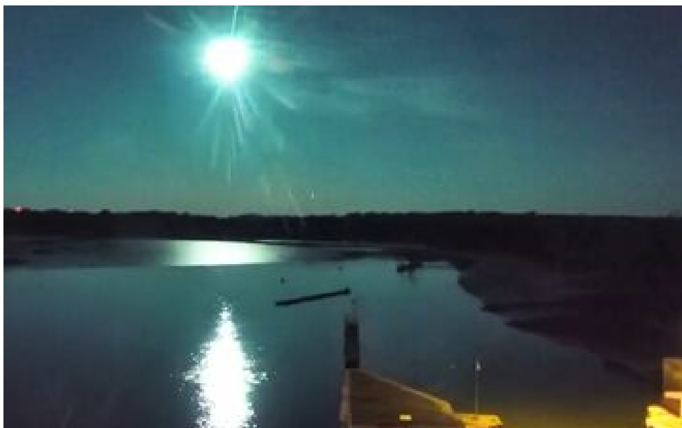
Bretagne : une probable météorite provoque un bruit sourd et une forte lumière dans le ciel en pleine nuit