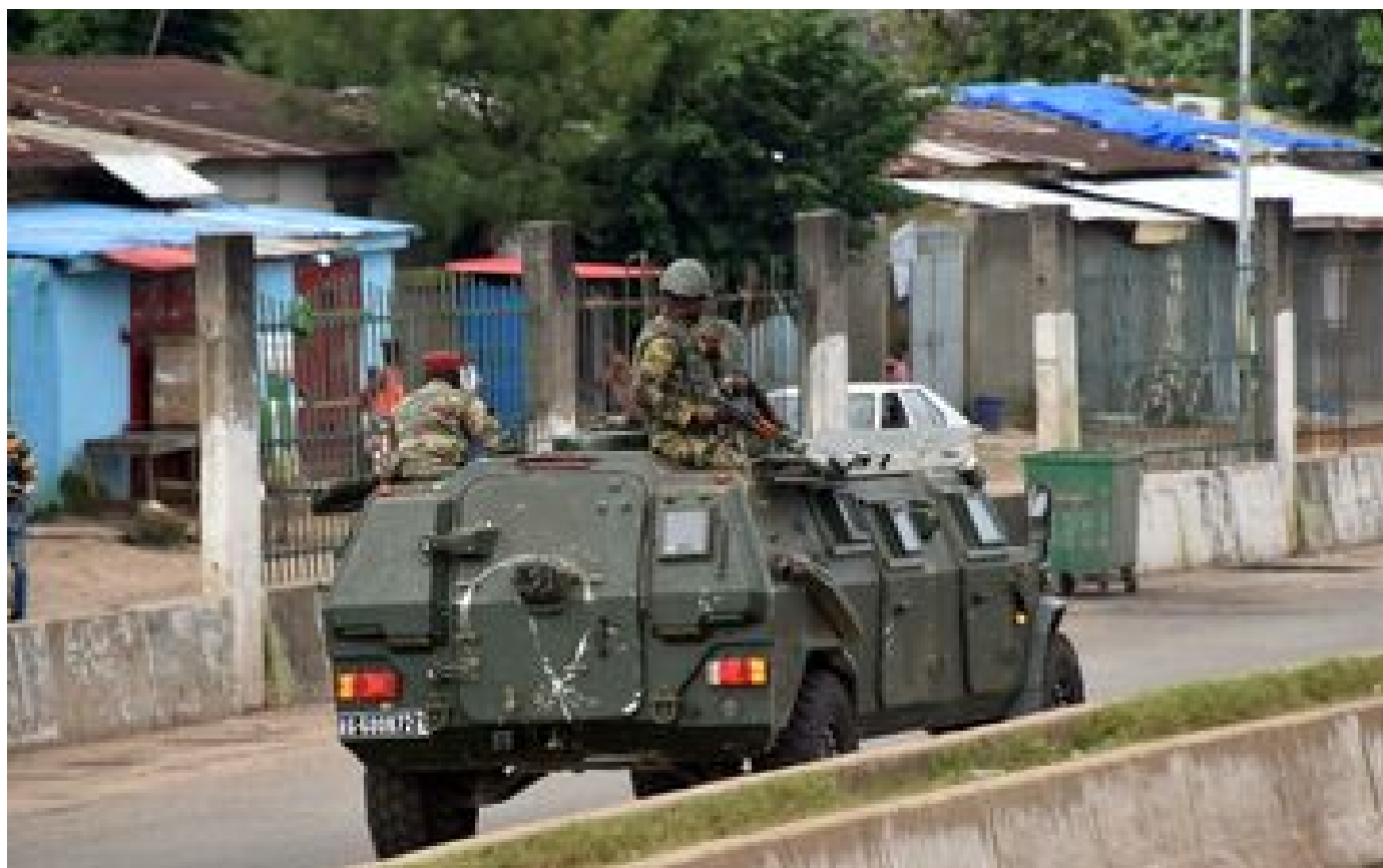
Tentative de coup d'Etat en Guinée, le président Condé «capturé» : ce que l'on sait