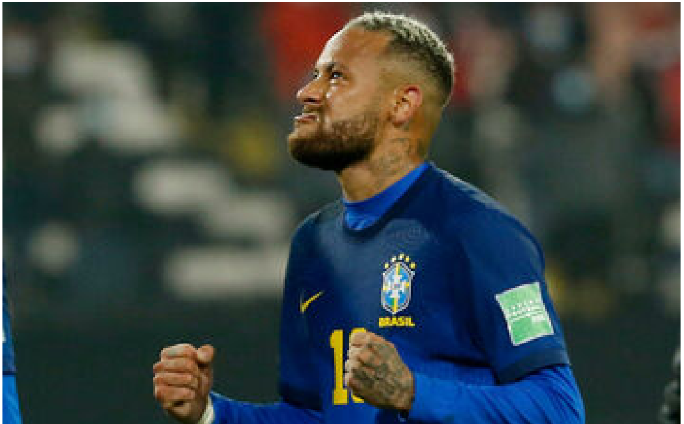
VIDÉO. Neymar «n'est pas en surpoids» affirme le préparateur physique brésilien