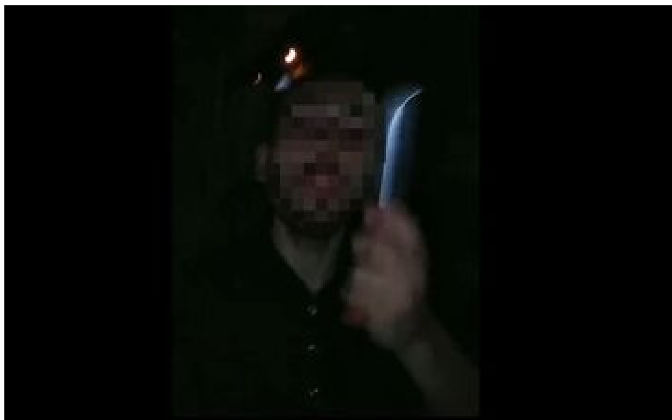
Abonnés Val-d'Oise : récidiviste, le harceleur de l'influenceuse a été cette fois-ci incarcéré