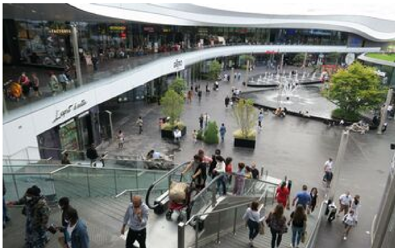
Abonnés Après la suspension du pass sanitaire dans les Yvelines et en Essonne, «les contentieux vont se multinier»