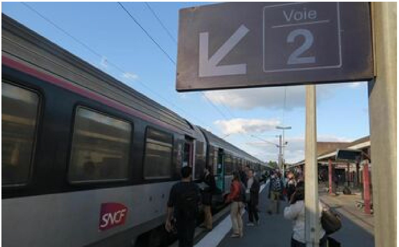
Marne : le trafic des TER interrompu entre Reims et Châlons après le déraillement d'un train de marchandises