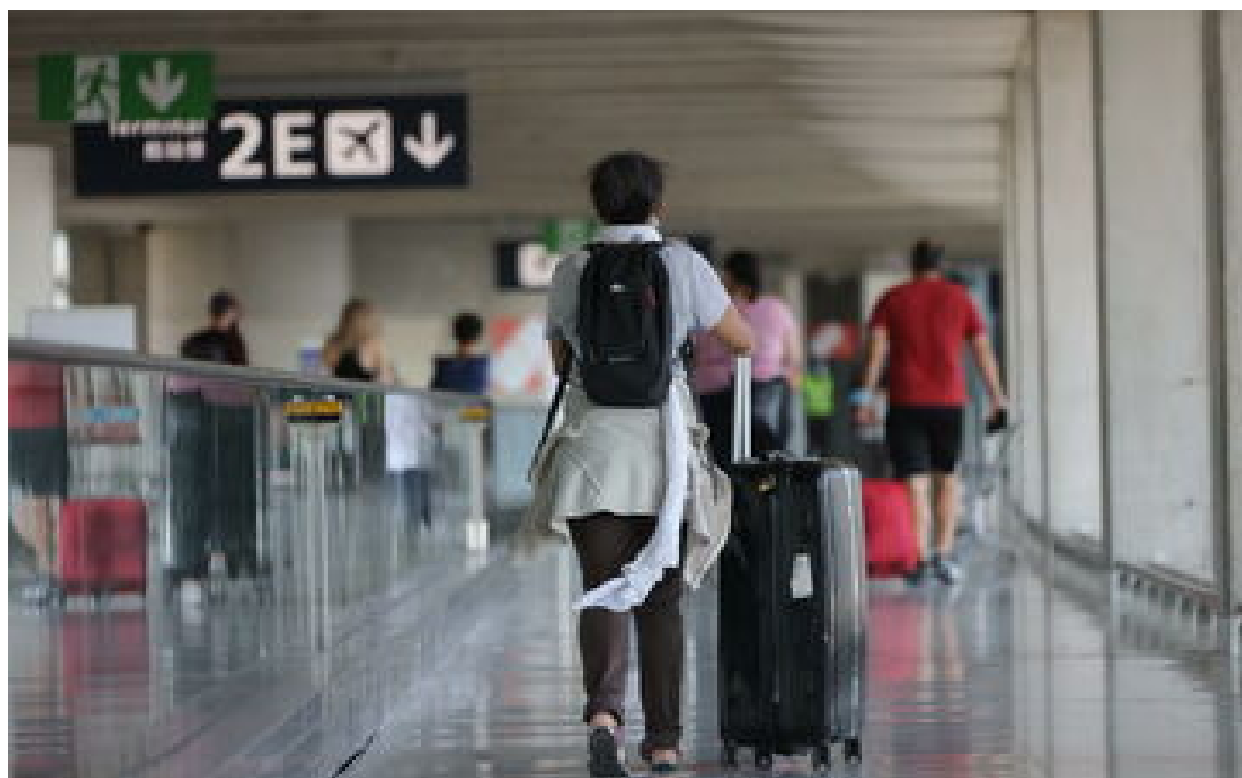
Covid-19 : la Turquie, la Géorgie et l'Iran placés sur liste rouge dès dimanche par la France