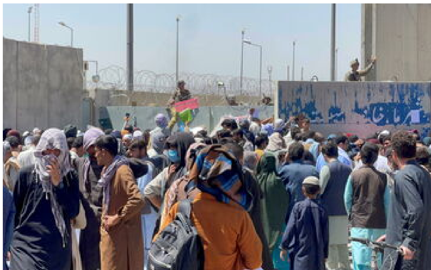
Attentat à Kaboul, hausse du prix du gaz et Kylian Mbappé : les infos à retenir ce midi