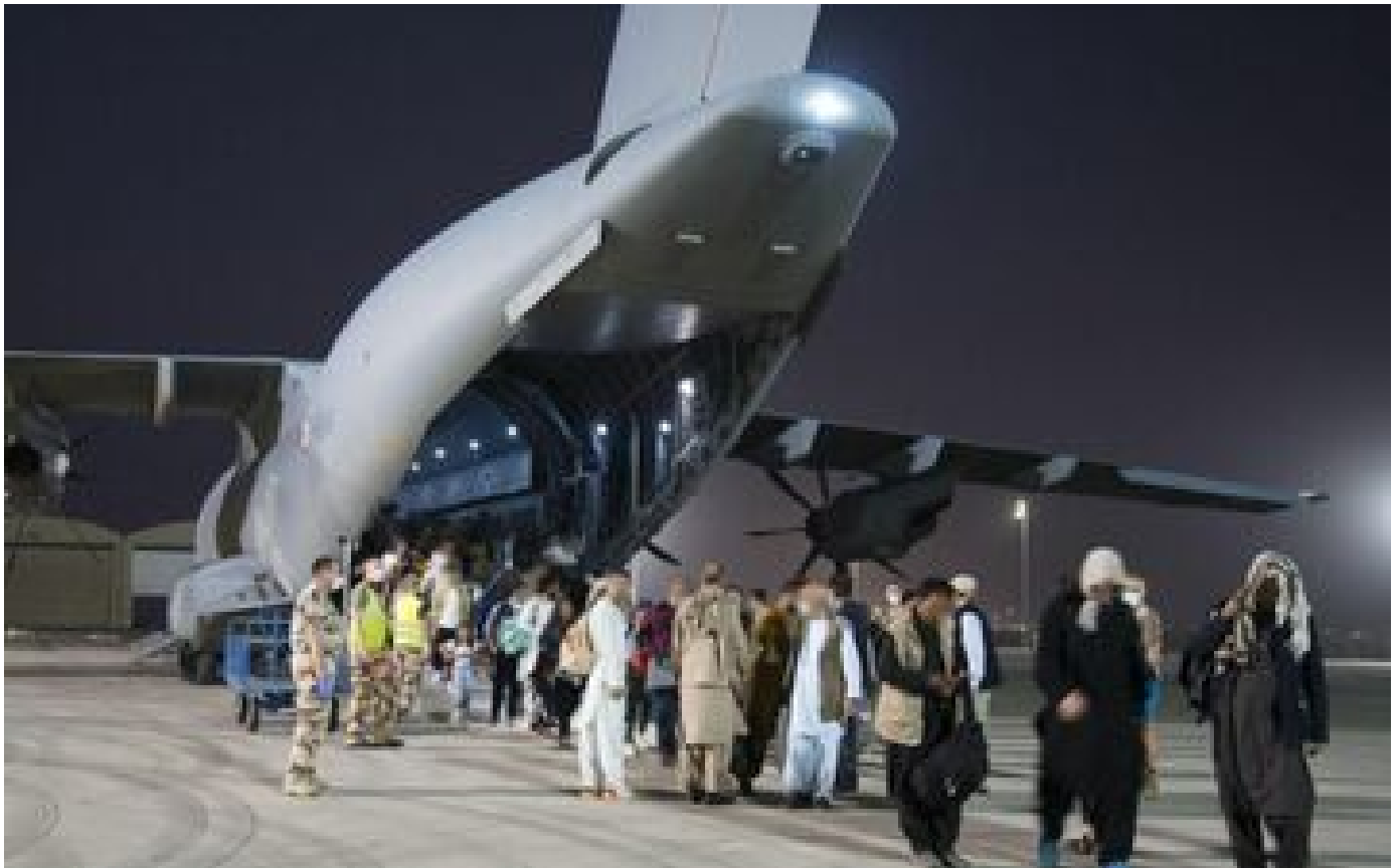
Afghans évacués : un «guichet spécial» créé à Paris pour enregistrer les demandes d'asiles