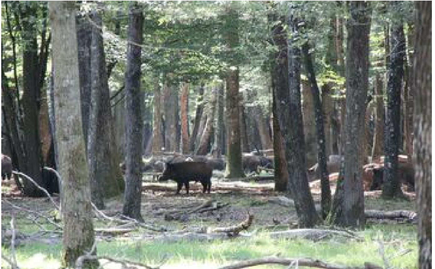
Abonnés Dans le Vexin, les sangliers ont leur sanctuaire... et les agriculteurs leur lot de dégâts