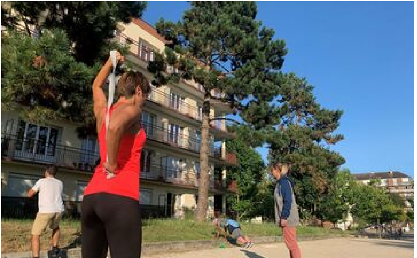
Maurepas : envie de vous remettre au sport avant la rentrée ? Testez les séances gratuites en plein air