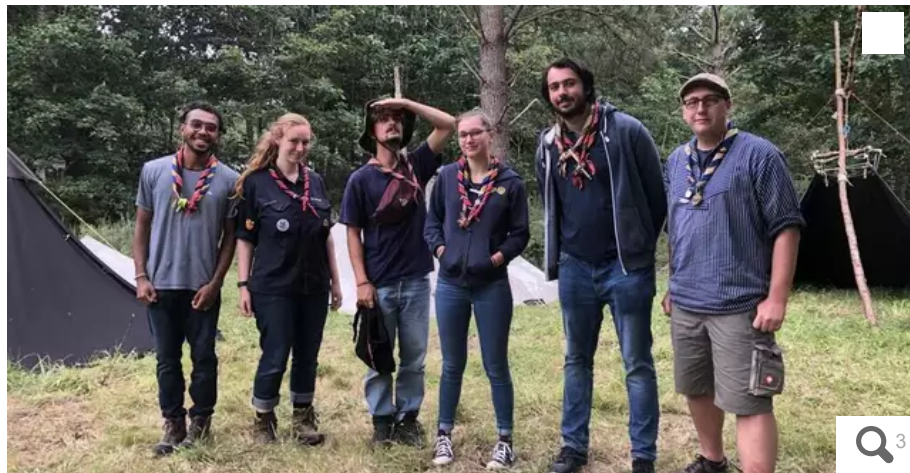
Les organisateurs du camp scout franco-allemand à Plœmeur, en août 2021.

Pendant une semaine, la base scout des Éclaireuses et éclaireurs de France a accueilli un camp franco-allemand. Une belle réussite pour ce projet qui se préparait depuis trois ans, mais qui avait dû être repoussé à cause de la crise sanitaire.