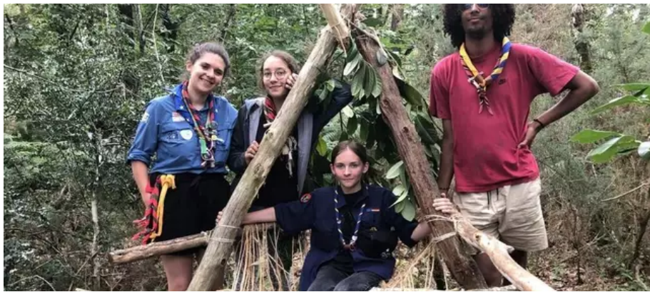
Des jeunes participants au camp scout franco-allemand à Plœmeur, en août 2021.