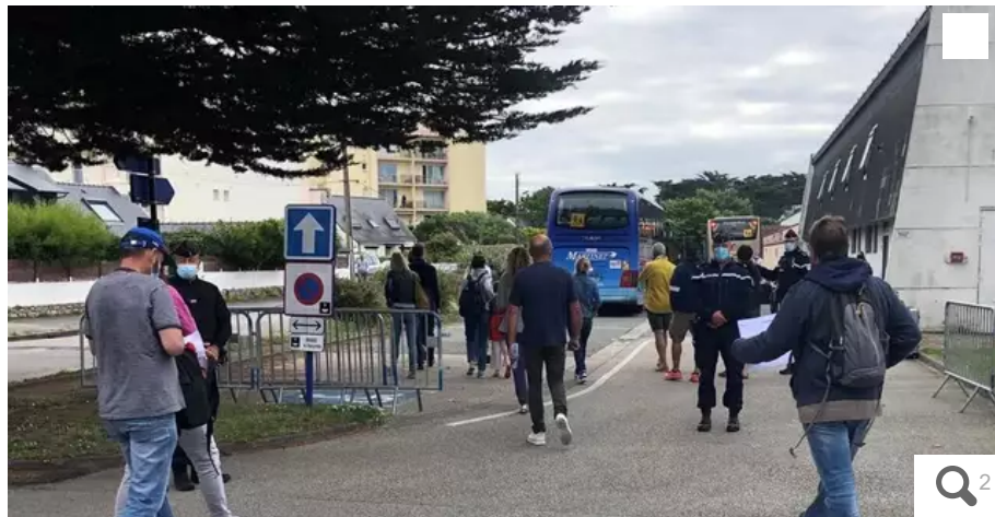
Certains parents sont venus récupérer leurs enfants au gymnase de Quiberon ce mardi matin.

Les enfants de la colonie de Belle-Île-en-Mer (Morbihan), où un cluster de 76 cas positifs au Covid-19 - 68 enfants et 8 animateurs – a été déclaré ces derniers jours, sont revenus sur le continent ce mardi 17 août 2021 au matin. Plusieurs moyens de transfert ont été mis en place. Certains parents ne cachent pas leur colère.