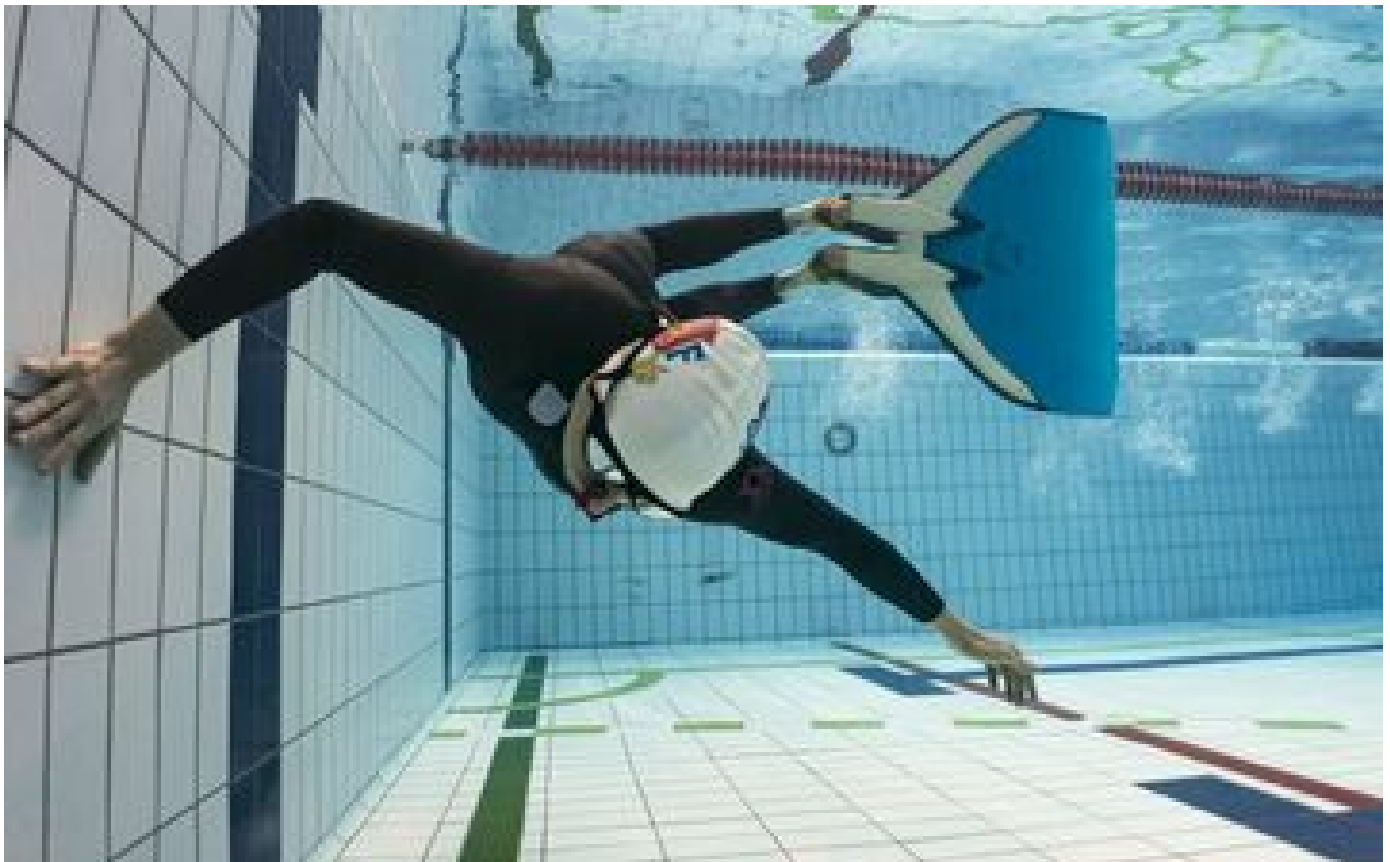
Abonnés On a testé l'apnée avec des compétiteurs de haut niveau