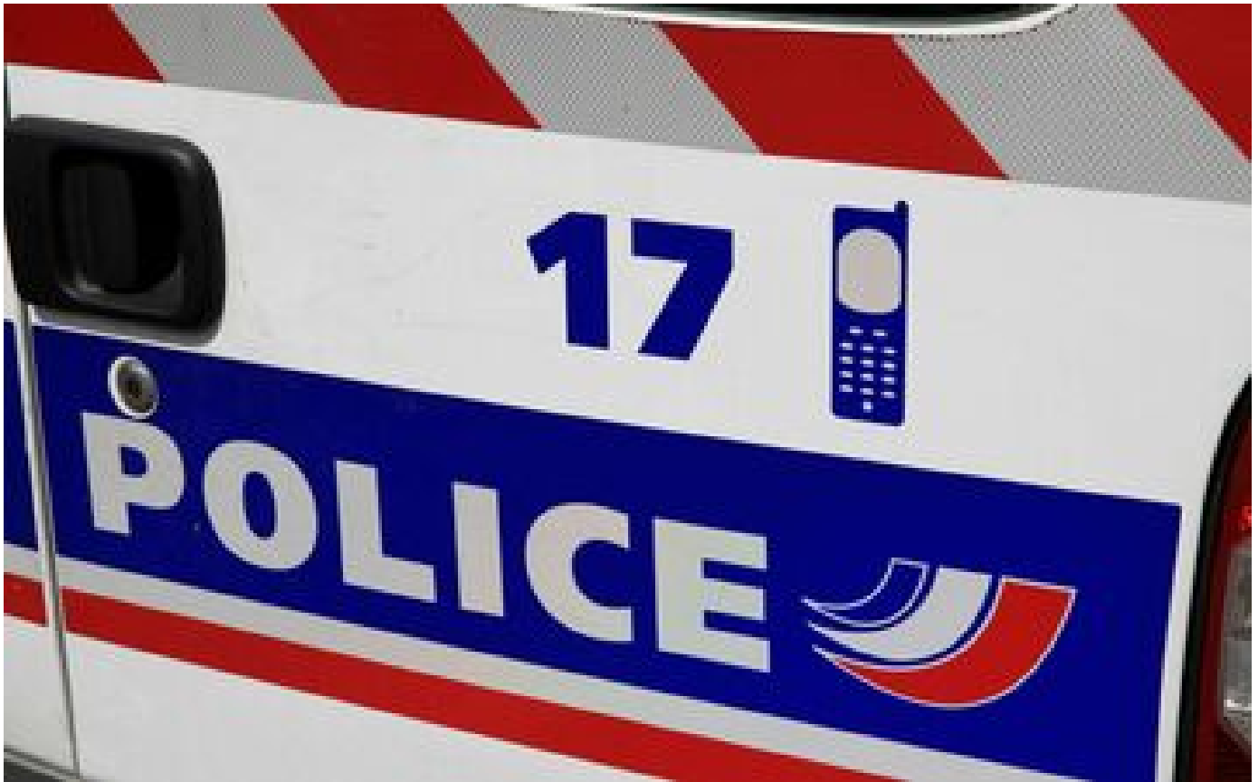
Saint-Cloud : il mord sa compagne lors d'une dispute et lui sectionne un petit doigt