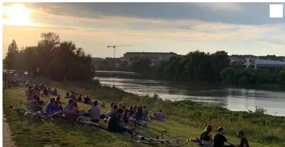
Les berges de la Loire sont occupées tout le long du quai François-Mitterrand.

Sortie. Privés de bars sans pass sanitaire, les étudiants et jeunes actifs sont nombreux à retourner sur les berges de la Loire.