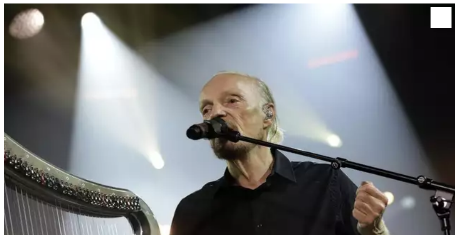
Alan Stivell a joué son nouveau spectacle, « Une vie pour la Bretagne et la musique ».

Le célèbre barde a conquis l'Espace Marine au Festival Interceltique de Lorient (Morbihan) au soir du mercredi 11 août 2021. Dans une salle comble, près de 2 500 spectateurs ont acclamé Alan Stivell.