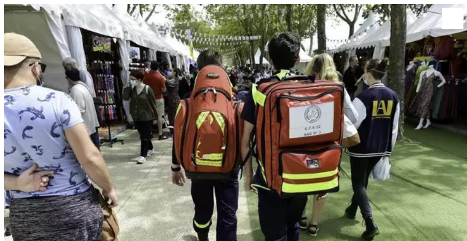
Le dispositif de sécurité du Festival engage des dizaines de personnes chaque jour. Ici les secouristes du CFS.

Le dispositif de sécurité du Festival Interceltique de Lorient (Morbihan) engage des dizaines de personnes chaque jour pendant dix jours. Un gros travail de coordination, invisible pour le festivalier.