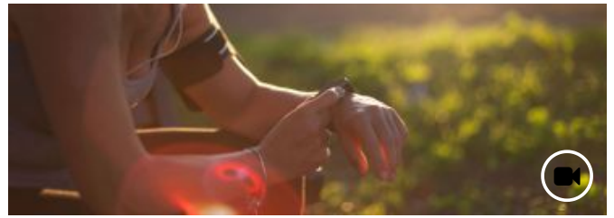
14h35 On a testé une montre connectée à bas prix