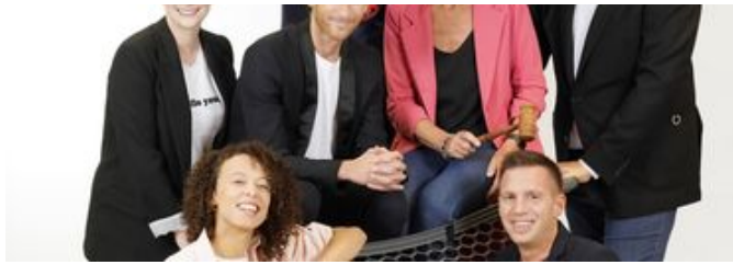
17h54 "On n'est pas des pigeons" : réagissez en direct