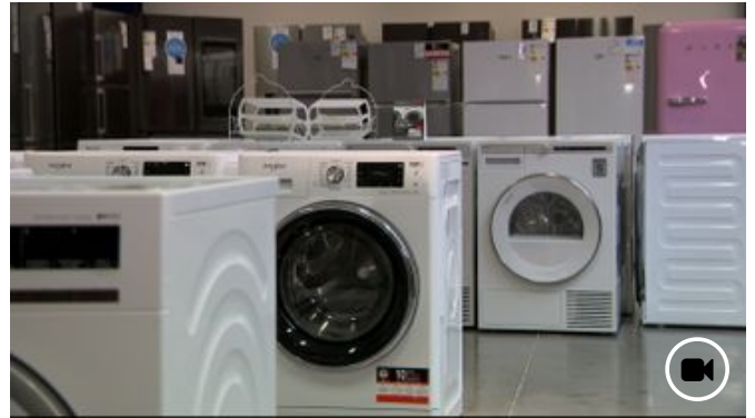
01 septembre 2021 Appareils électroménagers : problèmes d'approvisionnement et délais de livraison toujours fort longs