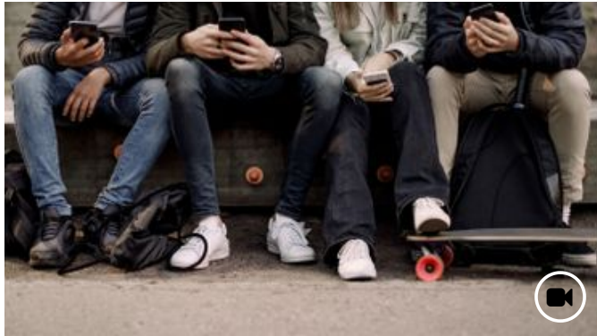
10h13 Quel premier smartphone acheter à mon ado ?