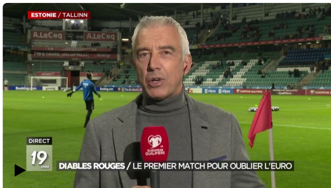
RTBF INFO - Info Diables Rouges : le premier match pour oublier l Euro