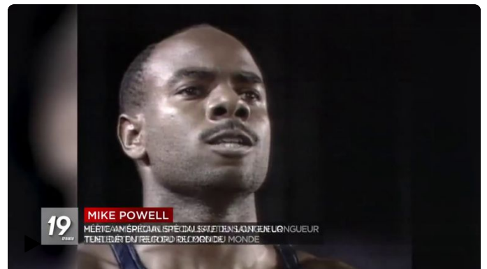
RTBF INFO - Info Mike Powell : une sculpture en son honneur à Bruxelles