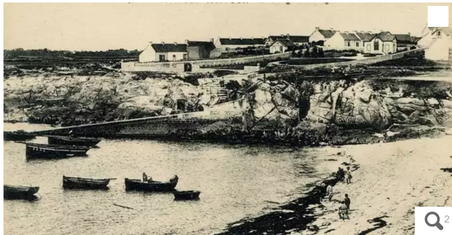
Le port de Kerroc'h au début du XXe siècle...

Plœmeur d'hier à aujourd'hui. Plus pittoresque que Lomener, le port de Kerroc'h a vu ses bâtiments changer au fil du temps. Aujourd'hui, le phare est devenu un lieu recueillant des données scientifiques.