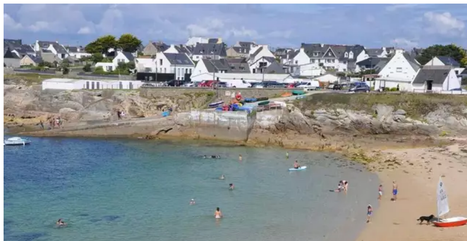
Le port de Kerroc'h aujourd'hui.

En 2017, le phare de Kerroc'h a été équipé d'un capteur de vent dans le cadre du projet « windmorbihan ». Les données relevées sont accessibles en temps réel sur le site windmorbihan.com