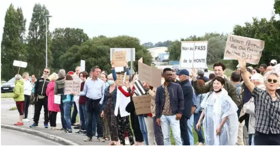
Une première manifestation s'est tenue ce samedi matin au rond-point de Lann Sevelin à Lanester.

Ce samedi matin, une première manifestation s'est déroulée au rond-point de Lann Sevelin à Lanester.