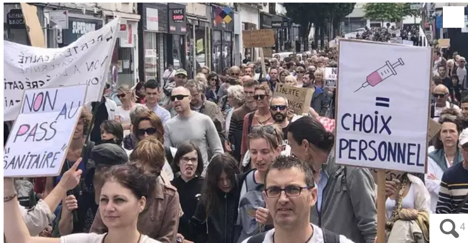
La rue Foch, à Lorient, remplie par le cortège des opposants au passe sanitaire. Plus d'un millier de manifestants.

Ce samedi 31 juillet 2021, ils sont trois fois plus nombreux que la semaine dernière à manifester dans les rues de Lorient (Morbihan) contre le passe sanitaire. Plus de 1 000 personnes sillonnent le centre-ville à force de slogans depuis 14 h 30.