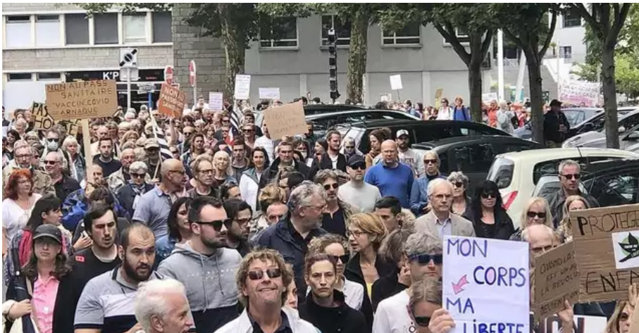
Plus d'un millier d'opposants au passe sanitaire ont défilé dans les rues de Lorient ce samedi 31 juillet 2021.

Les anti-passe sanitaire ont défilé en faisant un tour entier du rond-point de Lann Sévelin. Ce qui a momentanément freiné la circulation. Sans heurt ni invectives. Des automobilistes ont même klaxonné à tout-va, certains brandissant un bras par la vitre du véhicule en signe de solidarité.