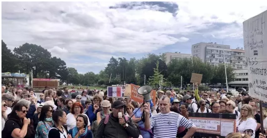
Lors des prises de parole, place de la mairie à Lorient, avant le défilé en ville des opposants au passe sanitaire. Plus d'un millier de manifestants.

C'est trois à quatre fois plus de personnes qu'il y a une semaine où l'on dénombrait environ 300 manifestants. Signe que l'opposition a de plus en plus d'écho dans la population ? « Je l'espère, confie Christian, 46 ans, venu d'Inzinzac. Il en va de nos libertés, de nos choix individuels. Que les