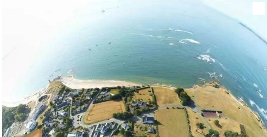
Photo du site concerné par le projet de lotissement à Kerpape, prise à partir d'un drone par l'association Tarz Héol.

L'association Tarz Héol (Plœmeur) explique pourquoi elle est satisfaite de l'annulation du permis d'aménager du lieu-dit Rorh-Mezh à Kerpape.